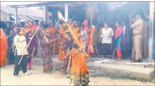
बूंदीभूड़ गांव में शराब की दुकान खुलने के विरोध में लाठी लेकर पहुंची महिलाएं।

कर ज्ञापन सौंपा था। उनका कहना था कि ग्राम पंचायत सीमा में शराब की दुकान नहीं खुलनी चाहिए। ग्राम