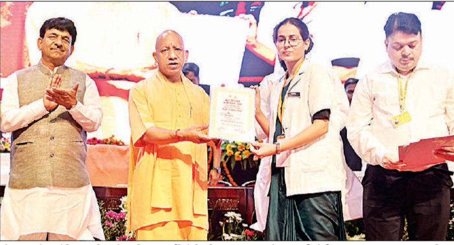
लोकभवन में आयोजित कार्यक्रम में चयनित अभ्यर्थी को नियुक्ति पत्र प्रदान करते मुख्यमंत्री योगी।

लोकभवन में आयोजित कार्यक्रम में मुख्यमंत्री योगी ने आयुष विभाग, व्यावसायिक शिक्षा एवं कौशल विकास विभाग तथा दिव्यांगजन सशक्तीकरण विभाग के लिए चयनित 481 अभ्यर्थियों को नियुक्ति पत्र वितरित किए। इस दौरान उन्होंने कहा कि परीक्षा के बाद भी किसी स्तर पर अनैतिक साधनों या सिफारिश की कोई गुंजाइश नहीं छोड़ी गई। मुख्यमंत्री ने कहा कि 2017 से पहले प्रदेश में भर्ती प्रक्रिया भ्रष्टाचार, जातीय और क्षेत्रीय पक्षपात से प्रभावित रहती थी, जिससे योग्य युवाओं का शोषण होता था। उन्होंने तीखा हमला बोलते हुए कहा कि यदि योग्य अभ्यर्थी की जगह घूसखोर व्यक्ति व्यवस्था में आ जाए तो वह 30-35 वर्षों तक पूरे सिस्टम को घुन की तरह खोखला करता है।