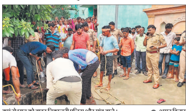
कुएं से छत्र को बाहर निकालती पुलिस और गांव वाले।