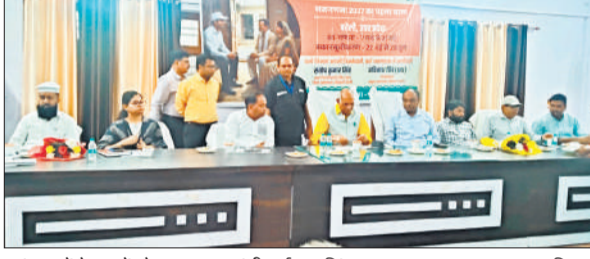
आंचला में बैठक में मौजूद पशुधन मंत्री धर्मपाल सिंह।

अमृत विचार : जनगणना-2027 के तहत स्व-गणना अभियान का गुरुवार को तहसीलों में जनप्रतिनिधियों ने शुभारंभ किया। इस दौरान आमजन से अभियान में भाग लेने का आह्वान किया गया।