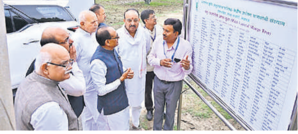
लखनऊ स्थित आईसीएआर-केंद्रीय उपोष्ण बागवानी संस्थान (सीआईएसएच) में कृषि विज्ञानी से बात करते केंद्रीय मंत्री शिवराज सिंह चौहान।

केंद्रीय मंत्री, गुरुवार को लखनऊ स्थित आईसीएआर-केंद्रीय उपोष्ण बागवानी संस्थान (सीआईएसएच) में आयोजित 'फ्रूट होराइजन 2026' कार्यक्रम में बतौर मुख्य अतिथि बोल रहे थे।