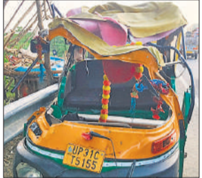
हादसे में क्षतिग्रस्त ऑटो।

अमृत विचार: थाना खमरिया क्षेत्र में शारदा नदी पर बने ऐरा पुल पर गुरुवार शाम तेज रफ्तार ट्रक और ऑटो की आमने-सामने की हुई भिड़ंत में 4 लोगों की मौत हो गई, जबकि 4 अन्य गंभीर घायल हो गए। हादसे के बाद पुल पर चीख-पुकार मच गई। पुलिस ने ट्रक चालक को हिरासत में ले लिया है। हादसा पीलीभीत-बस्ती मार्ग स्थित ऐरा पुल पर शाम करीब 4:15 बजे हुआ। ट्रक और ऑटो के बीच टक्कर इतनी भीषण थी कि ऑटो के परखच्चे उड़ गए और उसमें सवार लोग गंभीर रूप से घायल हो गए। स्थानीय लोगों और पुलिस की मदद से सभी घायलों को