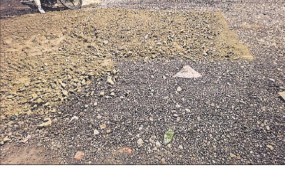
बजरी के ऊपर ही पत्थर बिछाए जा रहे हैं।

निर्माण कार्य शुरू होने के बाद लोगों को बेहतर सड़क की उम्मीद जगी, लेकिन अब निर्माण की गुणवत्ता को लेकर आपत्तियां सामने आने लगी हैं। नगर पालिका के नामित सभासद