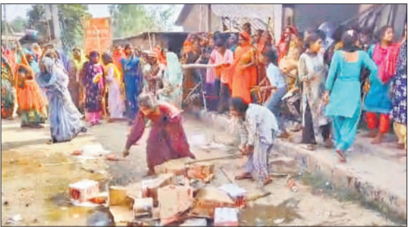
दुकान से बाहर निकालकर फेंकी गई शराब की पेटियों पर लाठी बरसाती महिलाएं।