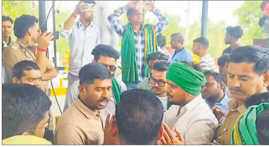
मुंडिया टोल प्लाजा पर टोल कर्मियों से बात करते किसान नेता।

भाकियू भानू से जुड़े किसान नेता दोहर में नैनीताल रोड पर मुंडिया मुकर्मपुर में बने टोल प्लाजा पर पहुंचे और धरने पर बैठ गए। किसानों के धरने पर बैठते ही वहां टोल प्लाजा वालों में हड़कंप मच गया। इसी बीच पहुंची पुलिस ने किसानों से टोल प्लाजा वालों से बात करने को कहा। किसान नेताओं और टोल वालों के बीच काफी देर तक नोकझोंक चली। किसानों का कहना था कि नियम के हिसाब से दोहना टोल के बाद यहां