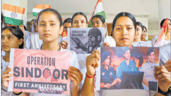
जम्मू में ऑपरेशन सिंदूर की बरसी पर स्कूली बच्चों ने सेना का हासला बढ़ाया।