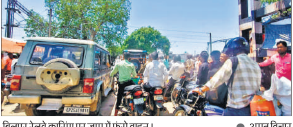
बिलपुर रेलवे क्रासिंग पर जाम में फंसे वाहन।

संवाददाता, फतेहगंज पूर्वी, ● अमृत विचार से जूझना पड़ा। दातागंज मार्ग पर बिलपुर क्रासिंग पर पूरे दिन जाम के हालात बने रहते हैं। बुधवार रात क्रासिंग का बूम खराब हो गया। वहीं इस फाटक पर ओवर ब्रिज का निर्माण चल रहा है। लोगों का कहना है कि जाम से निपटने के लिए पुलिस-प्रशासन को ठोस कदम उठाना चाहिए।