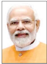
नरेंद्र मोदी प्रधानमंत्री

वर्ष 2026 की शुरुआत में मुझे सोमनाथ स्वाभिमान पर्व में सम्मिलित होने का सौभाग्य मिला। यह सोमनाथ मंदिर पर हुए पहले आक्रमण के एक हजार वर्ष बाद भी मंदिर के शाश्वत और अविनाशी होने का पर्व था। अब 11 मई को मुझे एक बार फिर सोमनाथ जाने का सुअवसर प्राप्त हो रहा है। इस बार यह यात्रा पुनर्निर्मित सोमनाथ मंदिर के लोकार्पण की 75 वीं वर्षगांठ के उपलक्ष्य में है। मैं उस क्षण को फिर जीने जा रहा हूँ, जब भारत के प्रथम राष्ट्रपति डॉ. राजेंद्र प्रसाद जी ने मंदिर का लोकार्पण किया था। उस दिन, सोमनाथ में विध्वंस से सृजन तक की यात्रा फिर से जीवंत होगी। छह महीनों के भीतर सोमनाथ के इतिहास से जुड़े इन दो अत्यंत महत्वपूर्ण पड़ावों का साक्षी सोमना मेरे लिए बहुत सौभाग्य की बात है।