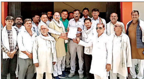
शनिवार को चरखारी ब्लाक में एकत्र हुए प्रधानों ने मांग उठाई।