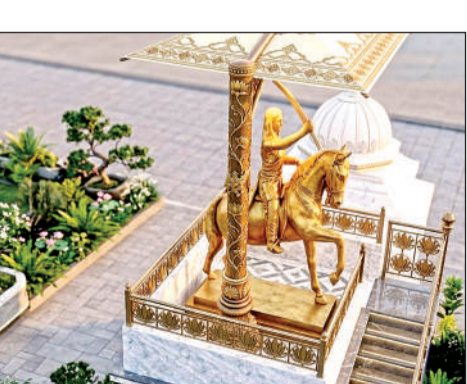
लोकमाता अहिल्याबाई होल्कर की प्रतिमा का मॉडल।

मंत्री के निरीक्षण के दौरान संबंधित अधिकारियों ने प्रस्तावित पार्क के स्वरूप, सौंदर्यीकरण और मूर्ति स्थापना से जुड़ी विस्तृत कार्ययोजना बताई। उन्होंने निर्माण कार्य को बेहतर गुणवत्ता के साथ समय पर तरीके से पूरा करने के निर्देश दिए। चौराहे के आसपास लगी होर्डिंग्स को लेकर मंत्री ने