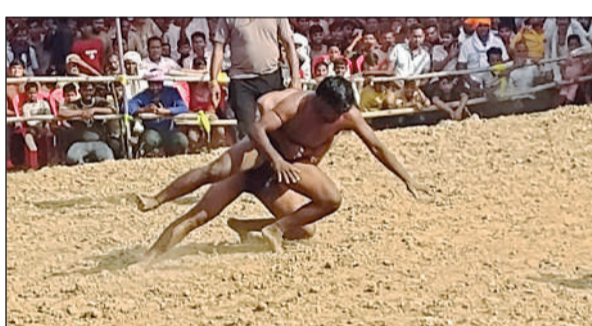
दंगल में दांव पेच दिखाते पहलवान। अमृत विचार

करीब 1.21 बजे घर के बाहर एक इको कार आकर रुकती है। कार से दो लोग उतरते हैं तथा घर का गेट खोल कर अंदर घुस गए। दो मिनट में दोनों चोर तीन बकरियां लेकर निकलते हैं और तेजी से इको कार में लाद कर भाग जाते हैं। सूचना पर पहुंची पुलिस कैमरे की फुटेज के आधार पर कार व चोरों की तलाश में कैद हुई घटना के अनुसार रात