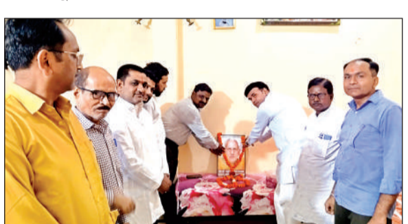
व्यापार मंडल के संस्थापक का जन्मदिन मनाते व्यापारी नेता।