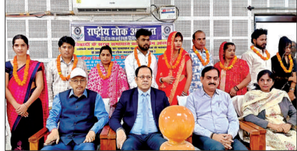
राष्ट्रीय लोक अदालत के दौरान वादों का निस्तारण करते जिम्मेदार।