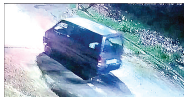
सीसीटीवी कैमरे में कैद हुई बकरियां लादकर ले जाती कार। अमृत विचार

खास बात तो यह है कि पुलिस ने व्यापारियों या अन्य तरह से सीसीटीवी कैमरे तो लगवा दिये पर इन की देखरेख नहीं की। कुछ कैमरे जमीन की ओर झुके हैं तो कुछ घटनाओं को कैद ही नहीं कर रहे हैं। यही नहीं इन कैमरों को जोड़ने के लिये डाली गई तारों की लाइन जगह जगह टूट चुकी है। इससे रिकार्डिंग ही नहीं हो रही है।