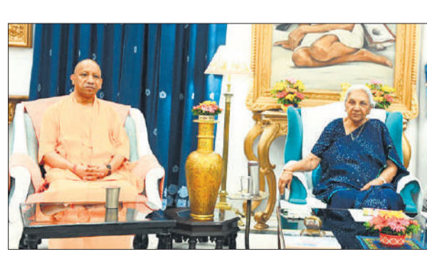
लखनऊ में राज्यपाल आनन्दीबेन पटेल से मुलाकात के दौरान मुख्यमंत्री योगी आदित्यनाथ।

को सौंपी। मुलाकात के दौरान मुख्यमंत्री ने राज्यपाल आनन्दीबेन को लालचंद राम द्वारा लिखित पुस्तक भारतीय ज्ञान परंपरा की अवधारणा भी भेंट की।