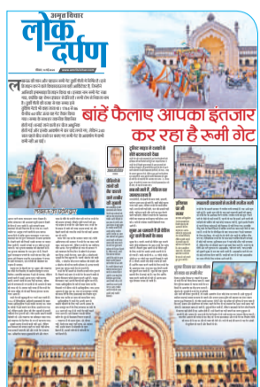
इस बार के रविवारीय संस्करण 'लोक दर्पण' में, बाहे फेलाए आपका इंतजार कर रहा है रूमी गेट व अन्य विषयों पर विशेष सामग्री दी जा रही है।