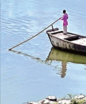
नाव में बैठकर नदी पार करना मजबूरी बन गई है।

जान जोखिम में डालकर प्रतिदिन नावों से जाते-आते छात्र-छात्राएं