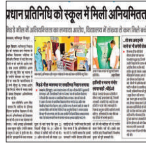
पांच मई को प्रकाशित समाचार।