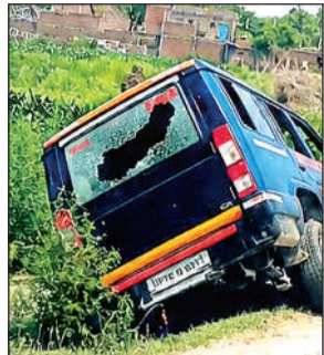
पुलिस जीप का टूटा शीशा।

पुलिस बल के साथ मौके पर पहुंचे और जांच शुरू की। जांच के दौरान परिजन ई-रिक्शा पर शव लेकर शराब ठेके पर रखने के लिये ले जा जाने लगे, जिसका पुलिस ने विरोध किया तो परिजनों के साथ ग्रामीण आक्रोशित हो गए। ग्रामीणों ने शराब ठेके पर जमकर तोड़फोड़ की। ठेके के निकट ही पुलिस व ग्रामीणों की झड़प हो गयी, आक्रोशित ग्रामीणों ने