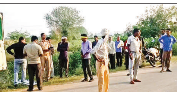
घटना स्थल पर मौजूद लोगों की भीड़। | अमृत विचार