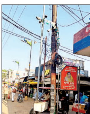
चौराहे पर बंद पड़े सीसीटीवी कैमरे और नीचे लटक का बॉक्स। अमृत विचार

अपराधियों और अपराधों पर अंकुश लगाने व घटनाओं को अंजाम देने वाले अपराधियों तक पहुंचने के लिए सीसीटीवी कैमरे नगर के मुख्य मार्ग सहित अन्य स्थानों पर लगाए गए थे। देखरेख के अभाव में अधिकतर कमरे या तो बंद पड़े हैं या खराब हो गए हैं। कस्बा के मुख्य चौराहे पर स्थित पुलिस चौकी के निकट करीब 4 महीने पहले लगाए गए उच्च क्षमता वाले कैमरे भी बंद पड़े हैं। इनके लिए लगाया गया बॉक्स भी करीब 6 फीट नीचे पोल