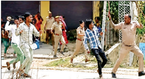
पथराव के बाद भागते पुलिस कर्मी।