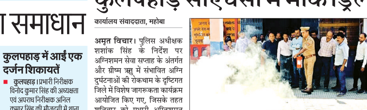
मॉक ड्रिल के दौरान अग्निशमन यंत्रों की जानकारी देती टीम। अमृत विचार

असावधानी भी बड़ी दुर्घटना का कारण बन सकती है, इसलिए सभी संस्थानों एवं नागरिकों को सतर्क रहते हुए अग्नि सुरक्षा मानकों का पालन करना आवश्यक है। कहा कि अक्सर नासमझी के चलते घरों में एलपीजी के सिलेंडर से आग लग जाती है। ऐसे में घबराने की आवश्यकता नहीं होनी चाहिए। आगजनी की घटना के दौरान पानी में भीगा बोरा सिलेंडर के ऊपर डालें, जिससे आग पर काबू पाया जा सकता है। उन्होंने नागरिकों को समझाते हुए कहा कि घरों में अक्सर