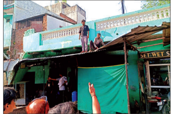
अभियान के दौरान घरों से टीन आदि हटाते लोग।