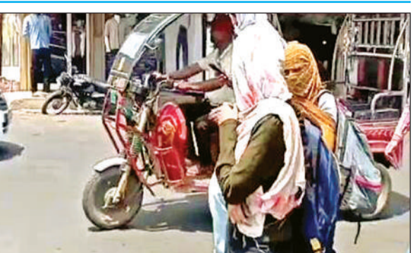
सिर पर स्टाल बांधकर निकलीं युवतियां। अमृत विचार

लोगों को जीना दुश्वार कर दिया था। अप्रैल के अंतिम सप्ताह में तापमान भी 45 डिग्री पहुंच गया था, लेकिन माई के पहले सप्ताह में