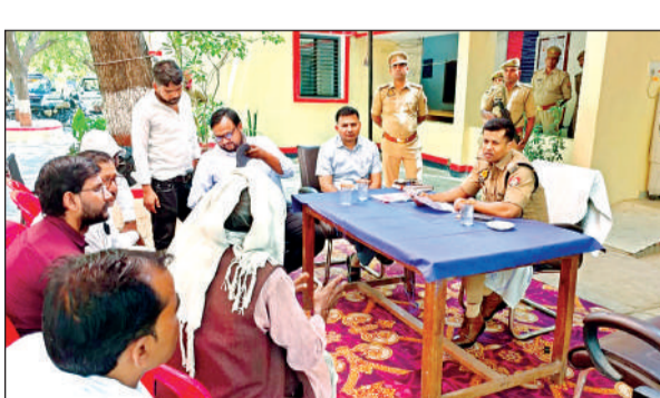
फरियादियों की शिकायत सुनते एएसपी।