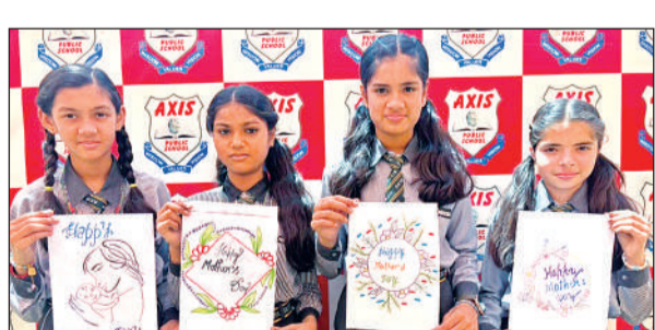
कार्यक्रम के दौरान मौजूद बच्चे।