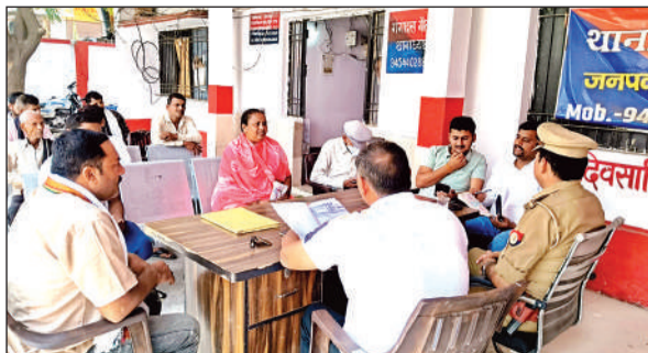
फरियादियों की शिकायतों को सुनते थानाध्यक्ष।