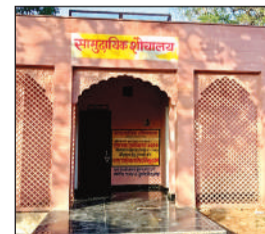
सीतापुर में निर्मित टायलेट ब्लाक।