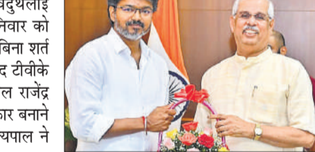
चेन्नई में राज्यपाल के साथ टीवीके प्रमुख विजय।