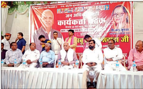
कार्यकर्ता सम्मेलन में बाबू सिंह कुशवाहा व अन्य कार्यकर्तागण।

बैठक को संबोधित करते हुए जन अधिकार पार्टी के प्रमुख एवं जौनपुर के सांसद बाबू सिंह कुशवाहा ने कहा कि विधान सभा चुनाव में अब केवल 8 माह शेष बचे हैं। गत दिनों हुए विभिन्न राज्यों के चुनाव में काफी धांधली हुई। इसलिए अब राजनीतिक जागरूकता होना आवश्यक है। ऐसे जनप्रतिनिधि को चुनने को आपका हित कर सके। फरुखाबाद में संकिसा भगवान के बुद्ध की धरती है। बच्चों की शिक्षा अच्छी हो और नौजवानों को रोजगार मिले। आरक्षण के हिसाब से समाज