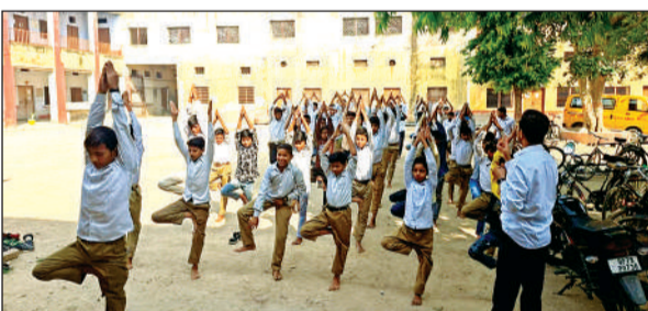
योग करते बच्चे।