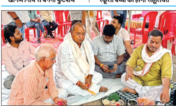
फुटपाथ निर्माण के लिए भूमि पूजन करते सदर विधायक। अमृत विचार

के बाद कहा कि फुटपाथ निर्माण से क्षेत्रवासियों, स्कूली बच्चों और आम लोगों को आवागमन की सुविधा मिलेगी। उन्होंने कहा कि उनकी प्राथमिकता जिले के हर कोने का बेहतर बुनियादी सुविधाओं से जोड़ना है। मुख्यमंत्री योगी आदित्यनाथ के नेतृत्व में जनपद में चहुंमुखी विकास हो रहा है। विधायक ने बताया कि कीरत सागर क्षेत्र में फुटपाथ की मांग काफी समय से की जा रही थी, जिसका निर्माण होने के बाद जहां पैदल चलने वाले राहगीरों, बच्चों