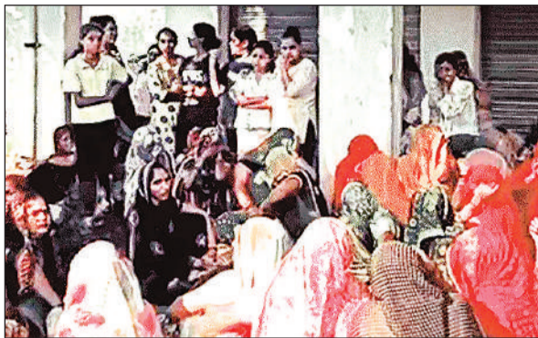
मृतक के रोते-बिलखते परिजन।