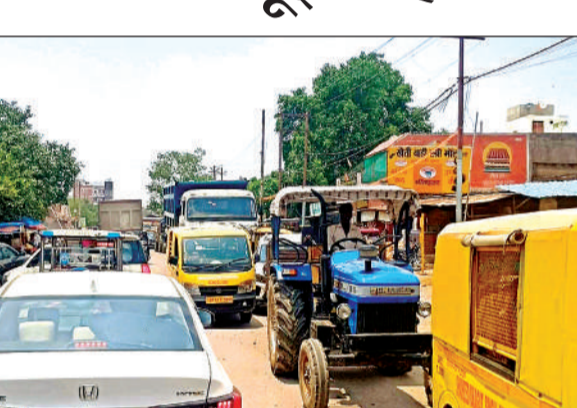
बांदा रोड पर शनिवार को भी जाम में फंसे रहे वाहन।

स्टेट हाईवे बांदा तिंदवारी मार्ग कस्बे के मध्य से गुजरा है। अभी कुछ दिन पूर्व ही इस सड़क का चौड़ीकरण किया गया है। अभी चौड़ीकरण का कार्य भी पूर्ण नहीं हुआ है। बस स्टॉप से देवागांव चौराहा तक दोनों तरफ डामरीकरण का कार्य पूर्ण हो गया है सड़क चौड़ी हो गई है। इस के बाद यह