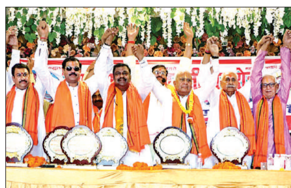
रामादेवी में महाराणा प्रताप की जयंती पर मौजूद अतिथि।