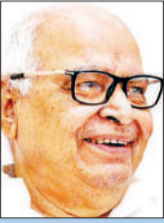
हृदय नारायण दीक्षित पूर्व विधानसभा अध्यक्ष उत्तर प्रदेश

हमारे ग्रंथों में ऋषियों की आयु का घर्घर नाद भी सुनता हूं। वह प्रतिपल हमारे सामने से ही गुजरता है। मैं हाथ उठाता हूं। रुकने की प्रार्थना करता हूं। वह नहीं रुकता। मेरी परवाह नहीं करता। जानता हूं कालरथ में ज्ञानी ही बैठते हैं। हमारे लिए उस रथ में जगह नहीं हो सकती। क्या विज्ञान में काल की समस्या का कोई समाधान है? काल निर्वचन कठिन काम है।