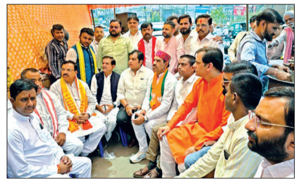
शपथ ग्रहण का प्रसारण देखते भाजपा नेता।