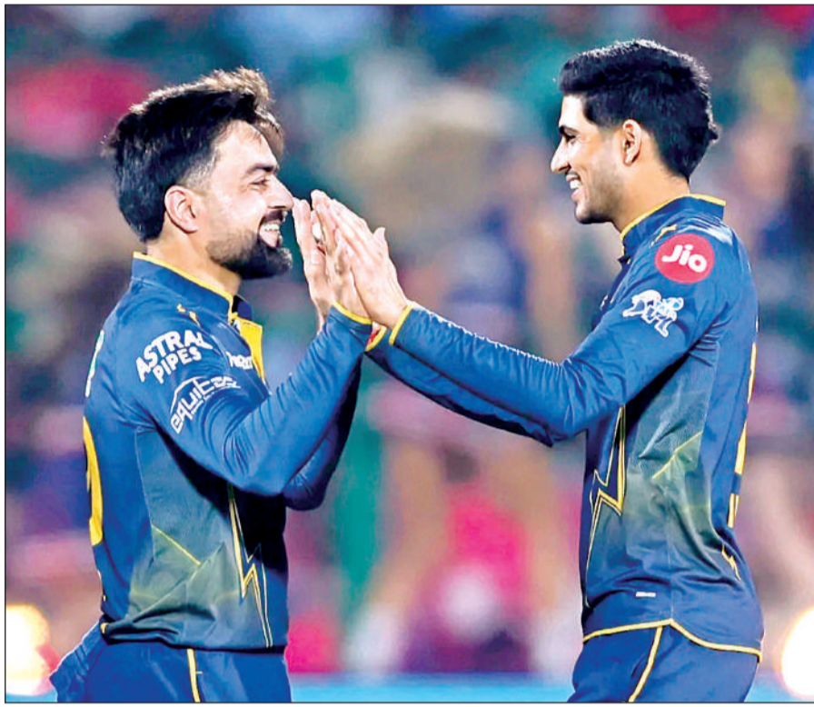
जीत का जश्न मनाते गुजरात टाइटंस के कप्तान शुभमन गिल (दाएं) व राशिद खान।

रॉयल्स के लिए रविंद्र जडेजा ने 25 गेंदों में 38, वैभव सूर्यवंशी ने 16 गेंदों में 36 और ध्रुव जुरेल ने 10 गेंदों में 24 रन का योगदान दिया।