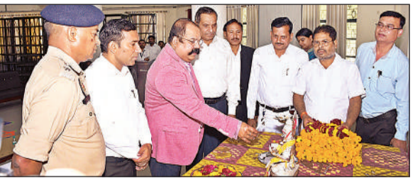
राष्ट्रीय लोक अदालत का शुभारंभ करते जिला जज।

लोक अदालत में 90 हजार से अधिक वादों को सुलह समझौते के आधार पर निपटारा गया। इसमें 7 करोड़ से अधिक की धनराशि भी वसूली गई। जिला जज ने राष्ट्रीय लोक अदालत के बारे में बताया कि इसके माध्यम से सुलह-समझौते के आधार पर अधिक से अधिक वाद