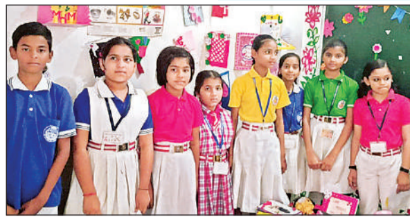
कार्यक्रम प्रस्तुत करते बच्चे।