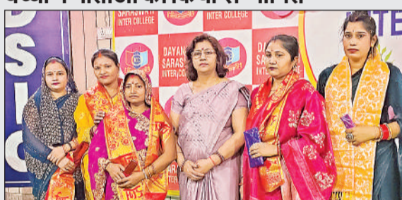
दयानंद स्कूल में माताओं को किया गया सम्मानित।