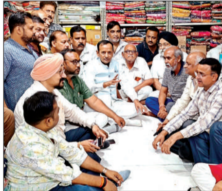
बैठक करते व्यापारी नेता।

वर्ष 2025 के नियम के तहत 9 मीटर से कम चौड़ी सड़क में केडीए द्वारा नक्शा पास न होने के कारण इन