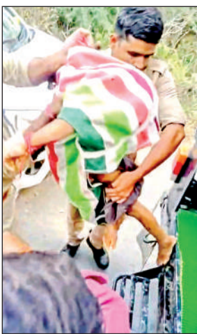
घायल को कंधे पर ले जाता सिपाही।