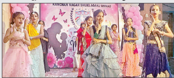
कार्यक्रम प्रस्तुत करते महर्षि स्कूल के बच्चे।