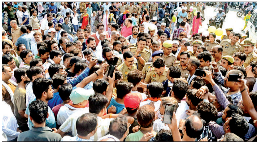
बड़ा चौराहा पर शव रखकर जाम लगाए लोगों को समझाती पुलिस।