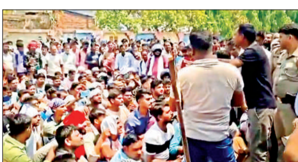
फुट वियर फैक्ट्री के श्रमिकों ने मेहनताना बढ़ाने की उठाई आवाज।

अमृत विचार: नोएडा में फैक्ट्री श्रमिकों के आंदोलन का मामला पूरे देश में चर्चा में रहा। अब कानपुर देहात के जैनपुर इंडस्ट्रियल एरिया के श्रमिकों ने हकों को लेकर आवाज उठाई है। शनिवार को एक बड़ी फैक्ट्री के मजदूर बाहर आकर हंगामा करने लगे। उनका कहना था कि भरपूर मेहनत के बाद भी उचित मेहनताना नहीं मिलता। घर के खर्चों से परेशानी है और प्रबंधन पगार नहीं बढ़ा रहा। उन्होंने सरकार द्वारा घोषित पूरी मजदूरी दिए जाने की मांग उठाई।