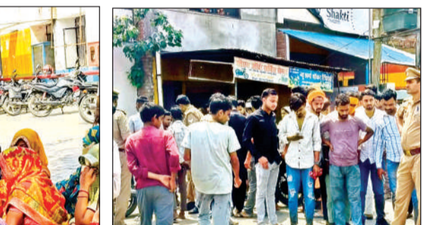
हादसे के बाद मौके पर भीड़ एकत्र हो गई।