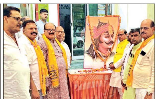
गोविंद नगर में भी मनाई गई जयंती।