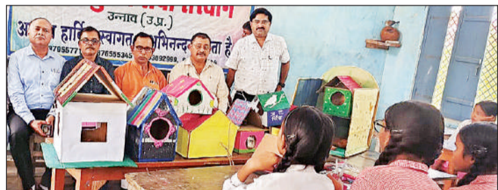
बच्चों द्वारा बनाए गए घोंसले देखते अभ्युद्य सेवा संस्थान के लोग।