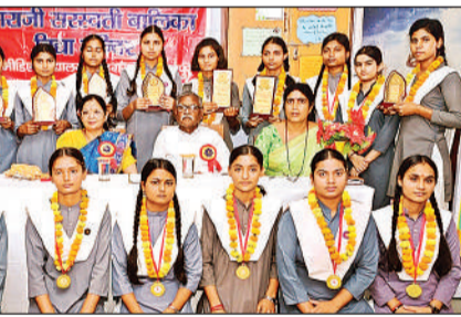
मेधावियों को सम्मानित करते शिक्षक।