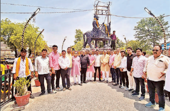
महाराणा प्रताप की प्रतिमा के सामने जुटे क्षत्रिय समाज के लोग।