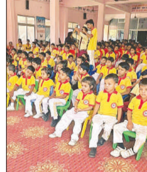
कार्यक्रम में मौजूद बच्चों।