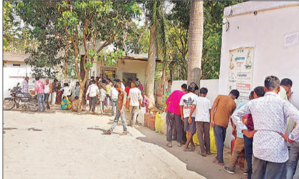
गैस एजेंसी पर लाइन लगाकर अपनी बारी का इंतजार करते उपभोक्ता।

आरोप है कि युवक ने एजेंसी संचालक का कॉलर पकड़ लिया और मारपीट शुरू कर दी। घटना के