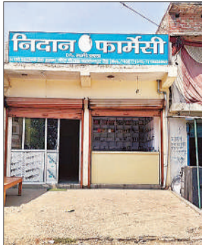
निदान फार्मसी यहीं पर बिगड़ी थी महिला की तबीयत।