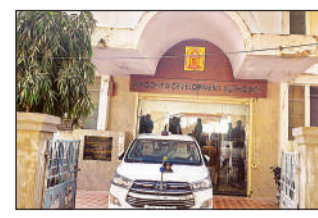
● 200 एकड़ तक हो सकता आवासीय कॉलोनी का फैलाव, शुरू हुई किसानों से जमीन खरीद

अमृत विचार: अयोध्या विकास प्राधिकरण, सरयू नदी पर पहली बड़ी आवासीय कॉलोनी डेवलप करने जा रहा है। इसके लिए किसानों से जमीन खरीद का काम शुरू कर दिया गया है। यह कॉलोनी श्रीराम मंदिर से महज 13 से 15 किमी दूर हाईवे पर स्थित होगी। कॉलोनी आधुनिकतम सुविधाओं से सुसज्जित होगी। इस साल के अंत तक इस पर तेजी से काम शुरू होने की उम्मीद है।