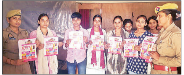
मिशन शक्ति के तहत छात्राओं को उनके हक के बारे में जानकारी देती महिला पुलिसकर्मी।