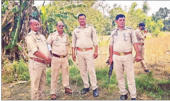
घटनास्थल पर जांच करने पहुंची पुलिस।