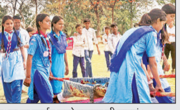
दक्षता का प्रदर्शन करते स्काउट की छात्राएं।