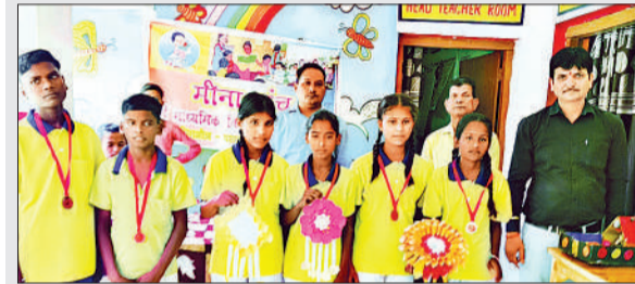
नाटक में अभिनय करने वाले बच्चों के साथ शिक्षक।

बच्चों ने नाटक से दिया नशा मुक्ति का संदेश