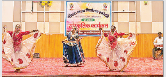
सांस्कृतिक कार्यक्रम प्रस्तुत करते कलाकार।