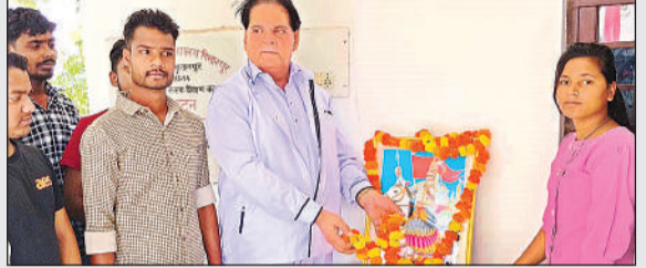
महाराणा प्रताप की प्रतिमा पर माल्यार्पण करते प्रबंधक।