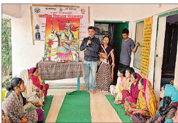
महाराणा प्रताप को श्रद्धांजलि अर्पित करते थारू समाज के लोग।