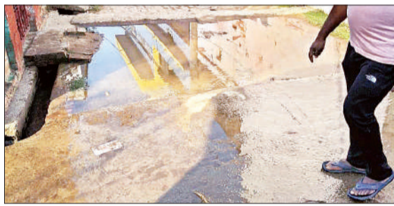
पेय जलापूर्ति की पाइपलाइन लीक होने से गली में हुआ जलभराव।