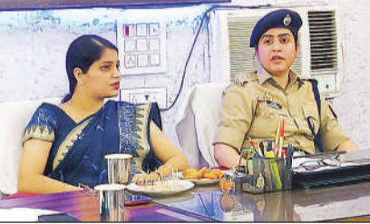
थाना समाधान दिवस

आपसी समन्वय स्थापित कर मौके पर जाकर नियमानुसार, समयबद्ध और गुणवत्तापूर्ण निस्तारण सुनिश्चित करें, ताकि आमजन को अनावश्यक रूप से परेशान न होना पड़े। थाना समाधान दिवस के दौरान प्राप्त विभिन्न प्रार्थना पत्रों के संबंध में जिलाधिकारी और पुलिस अधीक्षक द्वारा राजस्व एवं पुलिस की संयुक्त टीमों को मौके पर