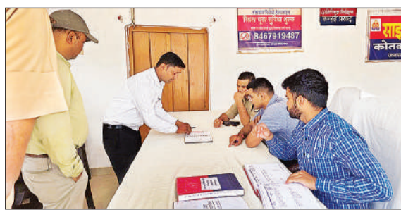
थाना समाधान दिवस में समस्याएं सुनते डीएम और एसपी।