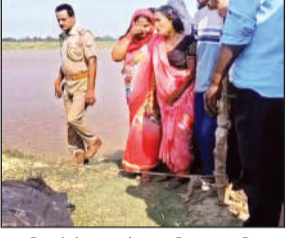
शव मिलने के बाद मौजूद परिवार व पुलिस।

नदी, ताल व पोखरों के पास बच्चों को न जाने दें