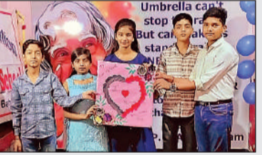
मां के प्रति प्रेम प्रदर्शित करते बच्चों।