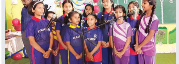
मातृ दिवस के अवसर पर प्रस्तुति देते स्कूली बच्चे।