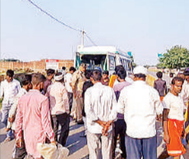
युवक को एंबुलेंस में भिजवाती पुलिस।