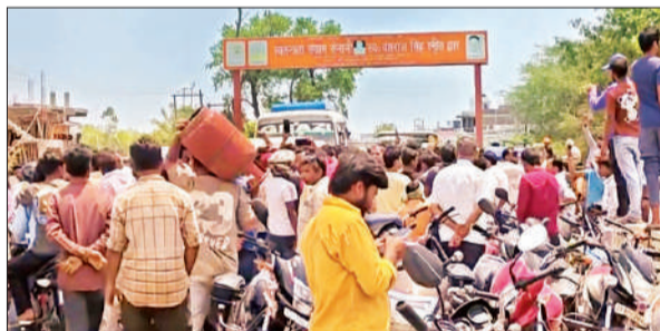
रसोई गैस सिलेंडर न मिलने पर नाराजगी जताते लोग। ● अमृत विचार

उपभोक्ताओं का आरोप है कि डीएम के स्पष्ट निर्देशों के बावजूद गैस एजेंसीयों घर-घर सिलेंडर पहुंचाने के बजाय गोदामों और अलग-अलग स्थानों पर मनमाने तरीके से वितरण कर रही हैं। भीषण गर्मी में महिलाओं, बुजुर्गों और मजदूर वर्ग को घंटों लाइन में खड़ा रहना पड़ रहा है। कारलीथान