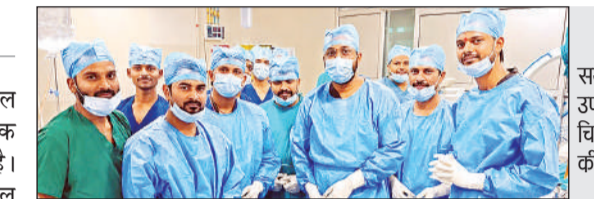
सर्जरी के उपरान्त चिकित्सकों की टीम।

अमृत विचार : राजर्षि दशरथ मेडिकल कॉलेज ने चिकित्सा इतिहास में एक महत्वपूर्ण उपलब्धि हासिल की है। यहां पहली बार आर्थोस्कोपिक एसीएल रिक्तकेशन सर्जरी (दूरबीन विधि द्वारा घुटने के लिगामेंट का नवनिर्माण) सफलतापूर्वक की गई।