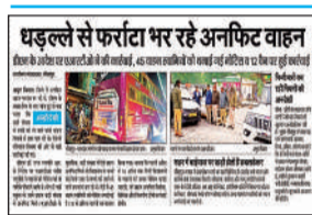
अमृत विचार में प्रकाशित खबर।

बनाया जहां से डगगामार संचालन की सर्वाधिक शिकायतें थीं, जिसमें लहरपुर-सीतापुर-लखनऊ मार्ग, लखीमपुर-सीतापुर-लखनऊ मार्गों से पकड़ी गई सभी 11 बसों को रोडवेज वर्कशॉप परिसर में खड़ा कराकर सीज कर दिया गया है।