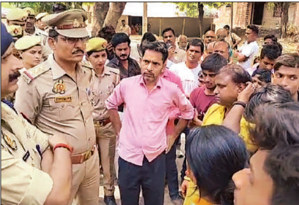
अंतिम संस्कार करने को लेकर परिजन से बातचीत करते सीओ व पुलिस कर्मी।

अमृत विचार। महाराणा प्रताप जयंती के अवसर पर शनिवार को अमेठी कस्बे में भव्य शौर्य यात्रा निकाली गई। यात्रा में सैकड़ों लोगों ने उत्साहपूर्वक भाग लिया। ढीजे की धुन, भगवा पताकाओं और जयघोषों के बीच पूरा कस्बा राष्ट्रभक्ति और वीरता के रंग में रंगा नजर आया। प्रशासन की ओर से सुरक्षा के कड़े इंतजाम किए गए थे और पूरे मार्ग पर पुलिस बल तैनात रहा। शौर्य यात्रा देवी पाटन मंदिर से शुरू होकर