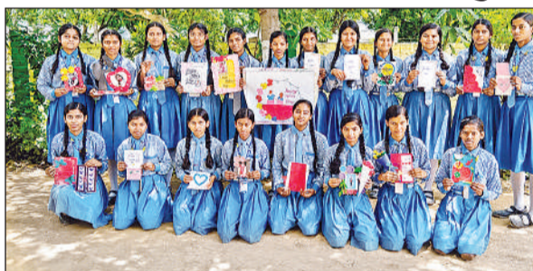
हरचंदपुर स्थित बाबू एलपीएस पब्लिक स्कूल में आयोजित कार्यक्रम में मौजूद बच्चे।

सेंट जेवियर इंटरनेशनल स्कूल में मना मातृ दिवस, लालगंज: शनिवार को सेंट जेवियर इंटरनेशनल स्कूल में मातृ दिवस हर्षोल्लास से