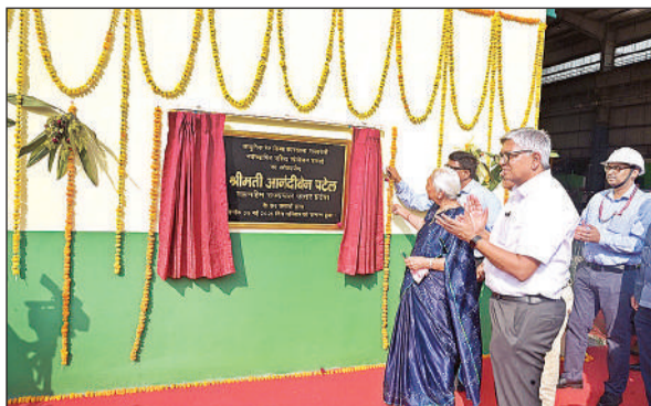
आधुनिक रेल डिब्बा कारखाना में आयोजित कार्यक्रम के दौरान राज्यपाल आनंदीबेन पटेल व संस्थान के अधिकारी।

अमृत विचार। आधुनिक रेल डिब्बा कारखाना (एमसीएफ) में उत्तर प्रदेश की राज्यपाल आनंदीबेन पटेल ने जन भवन के अधिकारियों एवं कर्मचारियों के साथ आयोजित चिंतन शिविर एवं प्रबंधन दक्षता संवर्धन कार्यक्रम में सहभाग किया। इस अवसर पर उन्होंने संस्थान की कार्यप्रणाली की और अधिक प्रभावी, पारदर्शी एवं परिणामोन्मुख बनाने पर विशेष जोर दिया। चिंतन शिविर के दौरान अधिकारियों एवं कर्मचारियों के बीच कार्य दक्षता, आपसी समन्वय, नवाचार आधारित कार्यप्रणाली तथा पारदर्शी प्रशासन को लेकर समूह चर्चाएं आयोजित की गईं।