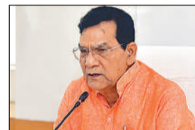
ऊर्जा मंत्री एके सिंह।

जो अब बढ़कर 630 यूनिट तक पहुंच गई है। इसी अवधि में प्रदेश की औसत पीक डिमांड लगभग 13,000 मेगावाट से बढ़कर 30,000 मेगावाट तक पहुंच गई है। पिछले वर्ष अधिकतम 31,468 मेगावाट और इस वर्ष 28 अप्रैल को 29,475 मेगावाट की मांग की सफलतापूर्वक आपूर्ति की