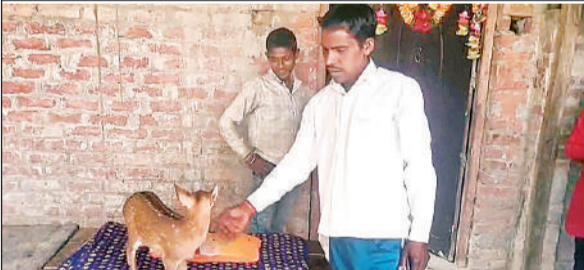
महाराजगंज के गजरी में पकड़ा गया हिरण का बच्चा।