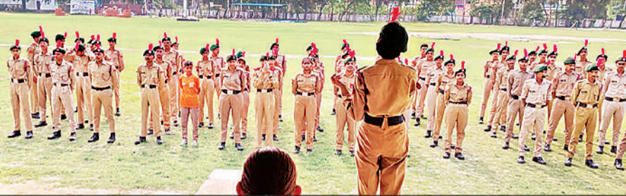
कार्यक्रम में एनसीसी कैडेट्स को जानकारी देती अधिकारी।