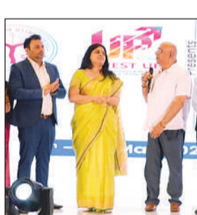
सीएफओ कॉन्क्लेव में उपस्थित कंपनियों के सीएफओ और प्रदेश के अधिकारी।