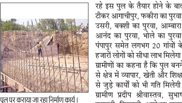
पुल पर कारया जा रहा निर्माण कार्य।

करीब डेढ़ दशक पहले क्षतिग्रस्त हुए इस पुल के कारण आसपास के गांवों के लोगों को रोजाना भारी परेशानियों का सामना करना पड़ रहा था। पुल बंद होने से ग्रामीणों को दूसरे रास्ते से करीब