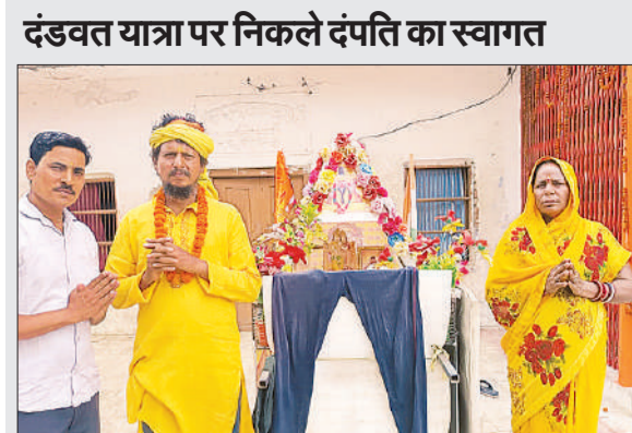
रामसनेहीघाट पहुंचे श्रद्धालु दंपति का किया गया स्वागत।