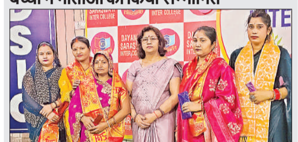
दयानंद स्कूल में माताओं को किया गया सम्मानित।