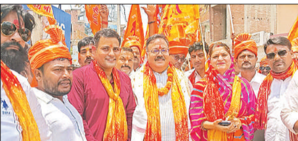
महाराणा प्रताप की जयंती पर शोभायात्रा निकालते लोग।