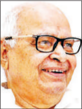
हृदय नारायण दीक्षित पूर्व विधानसभा अध्यक्ष उत्तर प्रदेश

प्राचीन भारत में 'कायाकल्प' की प्रक्रिया का वर्णन मिलता है, जहां विशेष जड़ी-बूटियों से वृद्ध शरीर को पुनः युवा किया जाता था। रूस का प्रयोग