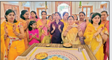
दिगंबर जैन मंदिर में पूजा-अर्चना करते श्रद्धालु।

समारोह में सेवानिवृत्त एबीपीएम को दी विदाई