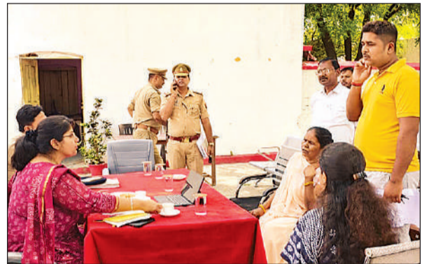
सदर कोतवाली परिसर में पीड़ितों की फरियाद सुनतीं डीएम सरनीत कौर ब्रोका।

जिलाधिकारी और पुलिस अधीक्षक ने सभी शिकायतों का संज्ञान लेते हुए संबंधित राजस्व एवं पुलिस अधिकारियों को मौके पर जाकर टीम बनाकर जांच करने और समयबद्ध एवं गुणवत्तापूर्ण निस्तारण सुनिश्चित करने के निर्देश दिए। जिलाधिकारी ने स्पष्ट कहा कि जनता की समस्याओं के समाधान