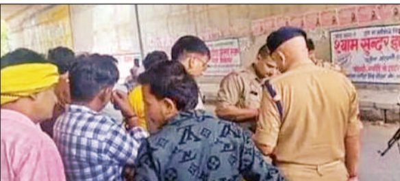
लूट की सूचना की जांच करते सीओ सलोन और कोतवाल।