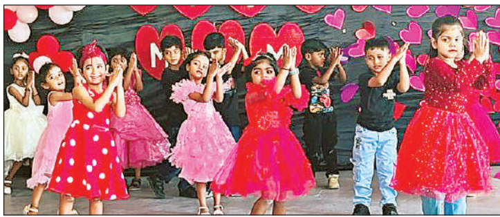
मदर्स-डे पर कार्यक्रम प्रस्तुत करते छात्र-छात्राएं।

संघर्षों से जूझ रही है। तपती धूप व भारी हथौड़े के बीच भी मां का आंचल बेटी के लिए सबसे सुरक्षित जन्मत बना हुआ है। यह दृश्य ने केवल वास्तव्य की पराकाष्ठा है बल्कि उस अदम्य साहस का भी प्रतीक है। जहां एक महिला अपने परिवार के बेहतर भविष्य के लिए फौलाद से टकराने का जज्बा रखती है।