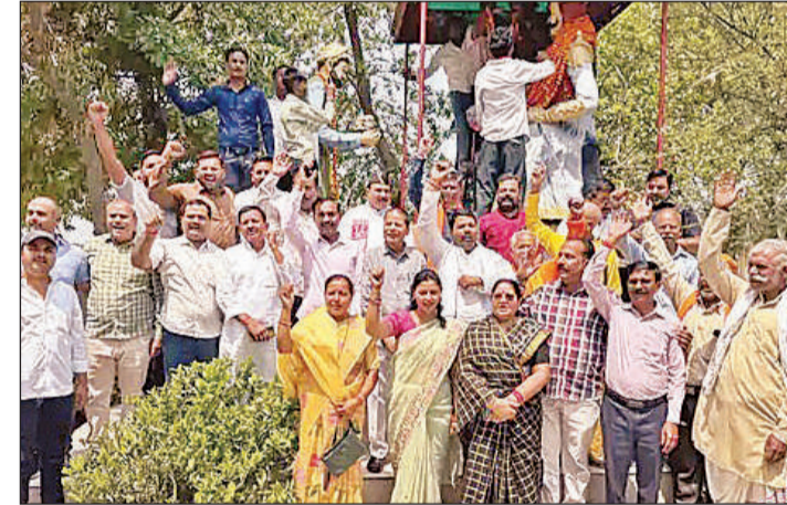
महाराणा प्रताप की प्रतिमा के समक्ष मौजूद लोग।