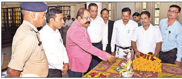
राष्ट्रीय लोक अदालत का शुभारंभ करते जिला जज।

लोक अदालत में 90 हजार से अधिक वादों को सुलह समझौते के आधार पर निपटाया गया। इसमें 7 करोड़ से अधिक की धनराशि भी वसूली गई। जिला जज ने राष्ट्रीय लोक अदालत के बारे में बताया कि इसके माध्यम से सुलह-समझौते के आधार पर अधिक से अधिक वाद