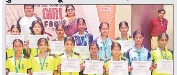
सरसैय्यद स्कूल की उपविजेता टीम।