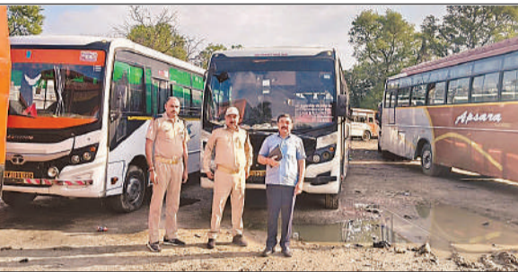
सीज बसों के साथ एआरटीओ सीतापुर।

बता दें कि ओवरलोड और डगगामार वाहनों से जुड़े मुद्दे को अमृत विचार ने प्रकाशित किया। इसी का संज्ञान जिलाधिकारी