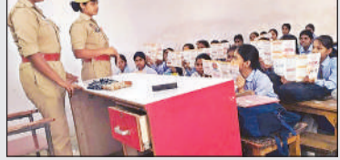
जामरूकात कार्यक्रम में मौजूद छात्राएं।