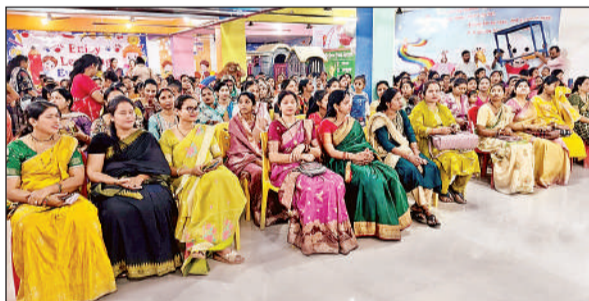
सेंट जेवियर स्कूल के मातृ दिवस कार्यक्रम में मौजूद महिलाएं।