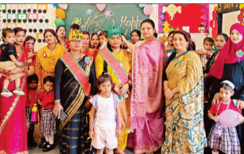
संस्कार ग्लोबल स्कूल में आयोजित कार्यक्रम मौजूद बच्चे व माताएं।

बाराबंकी, अमृत विचार : जनपद के विभिन्न विद्यालयों में शनिवार को मदर्स डे हर्षोल्लास और भावनात्मक माहौल में मनाया गया। इस दौरान बच्चों ने गीत, नृत्य, कविता, कार्ड मेकिंग और विभिन्न सांस्कृतिक कार्यक्रमों के जरिए अपनी मां के प्रति प्रेम और सम्मान व्यक्त किया। बहराइच रोड स्थित बाबा गुरुकुल