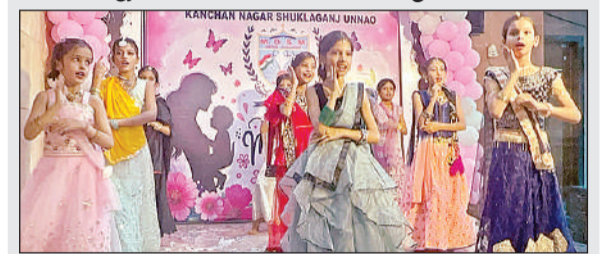
कार्यक्रम प्रस्तुत करते महर्षि स्कूल के बच्चे।