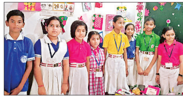
कार्यक्रम प्रस्तुत करते बच्चे।