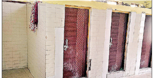
अमृत विचार में खबर छपने के बाद बदहाल शौचालयों में लगवाए गए नए दरवाजे।

बजाय उन्हें शौचालय के ऊपर दीवार पर विधिवत सजाकर रखे गये थे। ऐसी स्थिति में उल्टी दस्त