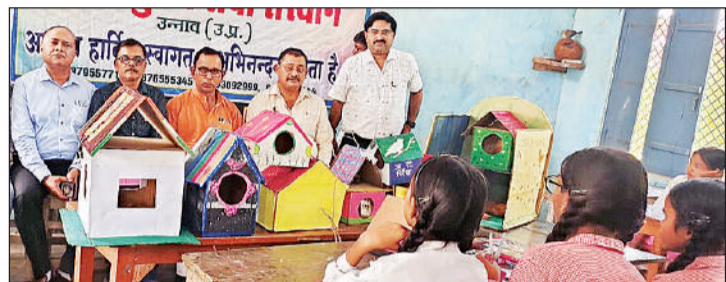
बच्चों द्वारा बनाए गए घोंसले देखते अभ्युद्य सेवा संस्थान के लोग।