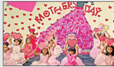
मदर डे पर कार्यक्रम प्रस्तुत करते बच्चे।