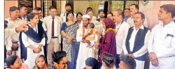
वादों के निस्तारण के दौरान एक हुए परिवार।