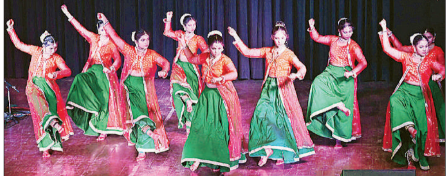
रायउमानाथ बली प्रेक्षागृह में कलायात्रा के तहत नृत्य की प्रस्तुति देते प्रतिभागी।