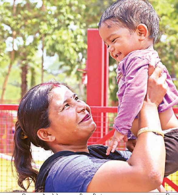
लखनऊ प्राणि उद्यान में बच्चे के साथ मस्ती करती मां। ● अमृत विचार

मां क्या होती है उनसे पूछिये जिनके पास मां नहीं है। मां जब तक है उसका दिल नहीं दुखाइये, जैसे उसने बचपन में दुलाराया था वैसे ही बुढ़ापे में उसे भी दुलार की जरूरत होती है क्योंकि मां के पांव के नीचे ही जन्मत होती है और मां ही धरती का ईश्वर होती है। हैप्पी मदर्स डे मां।