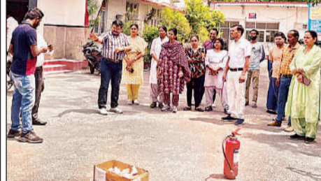
कार्यक्रम में अग्नि सुरक्षा से जागरूक करते अधिकारी।