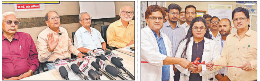
प्रेसवार्ता को संबोधित करते एआईआईबीपीआरए के सदस्य।