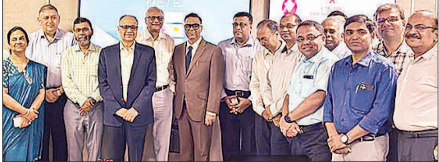
'ब्रेस्ट कैंसर: सेविंग ब्रेस्ट एंड सेविंग लाइव, द आर्ट ऑफ ऑनकोप्लास्टिक सर्जरी' विषयक सेमिनार में मौजूद विशेषज्ञ।