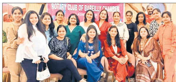
कार्यक्रम में मौजूद क्लब से जुड़ी महिलाएं।