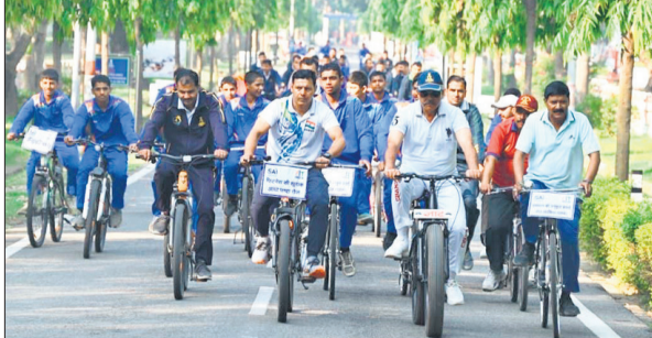
साइकिल चलाते सेना के जवान और छात्र।

अमृत विचार: रविवार को सुबह कैंट की सड़कों पर अलग ही नजारा देखने को मिलता है। सुबह-सुबह फिटनेस का संदेश देती साइकिल रैली भारतीय खेल प्राधिकरण सेंटर से निकली। इसके माध्यम से रोजाना 30 मिनट साइकिल चलाने का संदेश दिया जाता है। ये रैली हर रविवार को निकलती है। संडे ऑन साइकिल रैली में सेना के जवानों, खिलाड़ियों और प्रशिक्षकों ने उत्साह के साथ भाग लिया। रैली धोपेश्वर नाथ मंदिर, धोपेश्वर नाथ चौक, कैंटोमेंट हॉस्पिटल, ऑफिसर मैस और अब्दुल हाफिज द्वार से होते हुए जाट रेजीमेंट सेंटर स्टेडियम पहुंची। पुरे रास्ते फिटनेस और स्वास्थ्य के प्रति जागरूक रहने का संदेश दिया गया। अधिकारियों और खेल