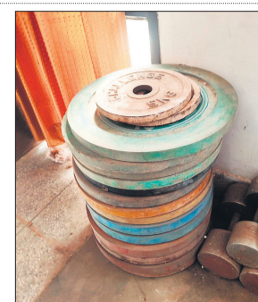
ऐसे ही पड़े वे।