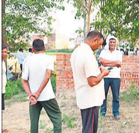
गांव में हंगामे की सूचना पर पहुंची पुलिस।