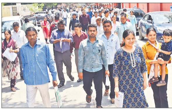
परीक्षा केंद्र बरेली कॉलेज से निकलते परीक्षार्थी।

रविवार को पहली पाली में नागरिक शास्त्र, गणित, अर्थशास्त्र, संस्कृत और मनोविज्ञान विषय की परीक्षा आयोजित हुई। इसमें 4413 पंजीकृत अभ्यर्थियों में 1812 उपस्थित और 2601 अनुपस्थित रहे। वहीं, दूसरी पाली में रसायन विज्ञान, भूगोल, हिंदी और कला विषय की परीक्षा हुई। इसमें 3707 में से 1755 अभ्यर्थियों ने परीक्षा दी। 1952 गैरहाजिर रहे। परीक्षा