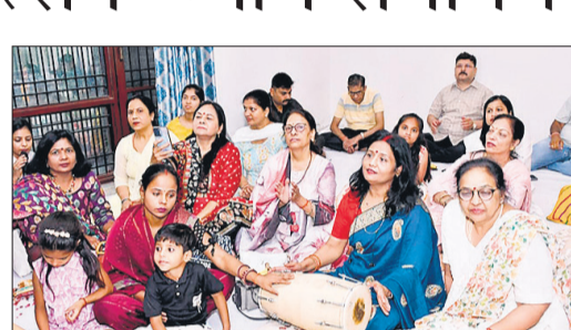
कार्यक्रम में भजन गाती महिलाएं।