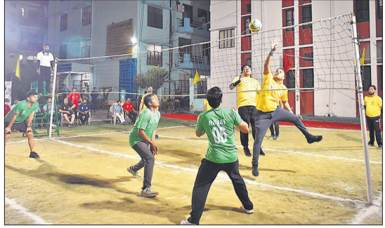
वॉलीबॉल के फाइनल में प्वाइंट के लिए जुझते खिलाड़ी।