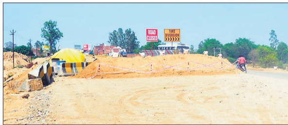
बदायूं रोड पर किया गया डायवर्जन।

हालात ये है कि 30 मिनट का सफर डेढ़-डेढ़ घंटे में पूरा हो रहा है। चौड़ीकरण कार्य धीमी गति से चलता देख हर कोई सिस्टम को कोस रहा है।