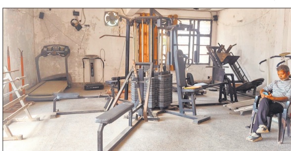
जिम में उपकरणों का कोई पुरसाहल नहीं।

कॉलेज प्रशासन ने विद्यार्थियों को बेहतर खेल और फिटनेस सुविधाएं उपलब्ध कराने के लिए जिम तैयार कराया था। समय के साथ इसकी स्थिति खराब होती चली गई। जिम में लगे ट्रेडमिल, डंबल, बेंच प्रेस और अन्य फिटनेस उपकरण देखभाल के अभाव में खराब हो गए हैं। कई मशीनों के पार्ट्स टूट चुके हैं। कुछ पर धूल की मोटी परत जमी हुई है। छात्रों का कहना है कि शुरुआत में जिम