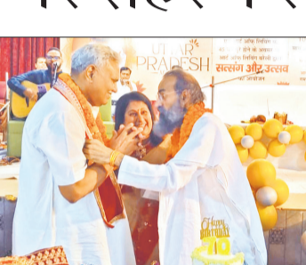
कार्यक्रम में पहुंचे योगी अनुराग।