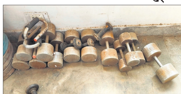
कोने में डाल दिए गए डंबल।

कुछ समय तक संचालित हुआ। बाद में इसकी देखरेख पर ध्यान नहीं दिया गया। धीरे-धीरे मशीनें खराब होती चली गईं। आज हालात यह है कि अधिकांश उपकरण इस्तेमाल लायक नहीं बचे हैं। दीवारों पर सीलन, जगह-जगह उखड़ा प्लास्टर और गंदगी दिखाई दे रही है। बरसात के दिनों में स्थिति और खराब होगी। खराब वातावरण के कारण भी जिम में आने वालों की संख्या कम होती गई।