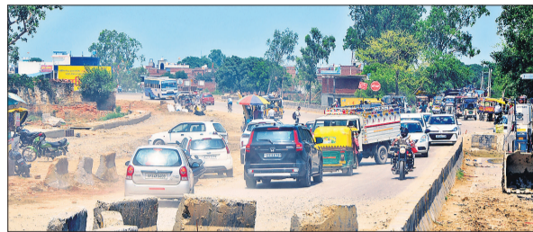
डायवर्जन के चलते रंग-रंगकर गुजरते वाहन।

से थोड़ा आगे बढ़कर चादपुर, कोनी, मकरंदपुर, भोलापुर, भमोरा, सिरौही, रसूलपुर और बरेखड़ा सहित 11 जगहों पर डायवर्जन रिकॉर्ड किए गए हैं। कई स्थान कहीं धार्मिक स्थलों के विस्थापन का पेंच फंसा है, तो कहीं कार्यदायी संस्था की हिलाई से काम अटका है। डायवर्जन से वाहन सवार परेशान रहे हैं। स्कूली गाड़ियों से पढ़ने जाने वाले बच्चे भी मुश्किल झेल रहे हैं। राहगीरों का कहना है कि पहले बरेली से