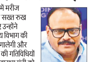
डिप्टी सीएम ब्रजेश पाठक।

पकड़ गया। विपक्षी दलों ने भी सरकार और स्वास्थ्य विभाग को निशाने पर ले लिया। विपक्षी नेताओं ने सोशल