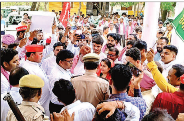
कलेक्ट्रेट में प्रदर्शन के साथ ज्ञापन देते सपा नेता और कार्यकर्ता।