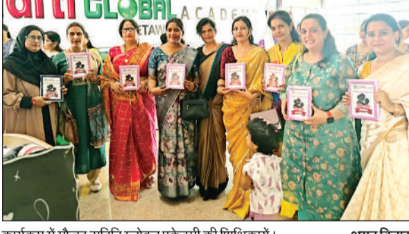
कार्यक्रम में मौजूद सुदिति ग्लोबल एकेडमी की शिक्षिकायें।