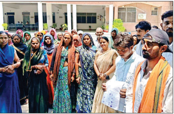
सोमवार को ज्ञापन देने कलेक्ट्रेट में पहुंचे प्रभावित सब्जी किसान। अमृत विचार

शुरू कर दिया गया था। बांध से लगातार पानी छोड़े जाने के कारण विरमा नदी के डाउनस्ट्रीम क्षेत्रों में जलस्तर बढ़ने की पहले से ही संभावना थी। इसको लेकर प्रशासन