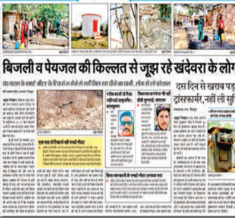
'अमृत विचार' में 11 मई को प्रकाशित समाचार।