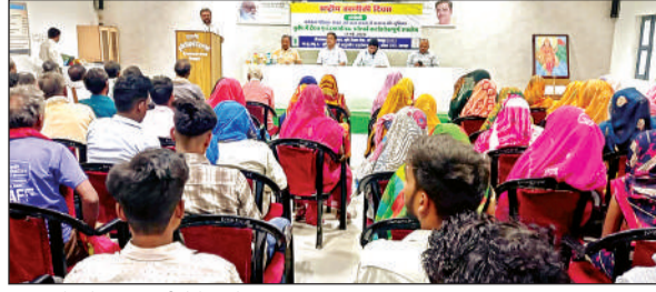
किसानों को जानकारी देते विशेषज्ञ।