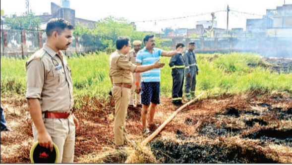
आग की घटना की जानकारी लेती पुलिस।