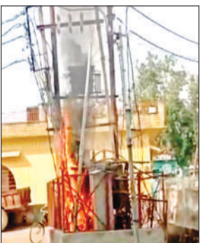
मौदहा में जलता ट्रांसफॉर्मर।

प्रत्यक्षदर्शियों के अनुसार आग धीरे-धीरे ट्रांसफॉर्मर से जुड़ी विद्युत केबलों तक पहुंच गई, जिससे बड़ा हादसा होने की आशंका बढ़ गई। भीषण आग और धमाकों जैसी आवाजों से दहशत में आए लोग अपने घरों से बाहर निकल आए। मोहल्लावासियों ने तत्काल विद्युत विभाग को सूचना दी। सूचना मिलते ही विद्युत विभाग के लाइनमैन