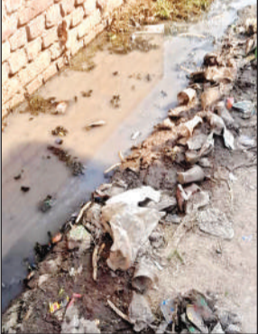
सफाई के अभाव में बजबजाती नाली।

अमृत विचार। विकासखंड भायनगर की ग्राम पंचायत फर्रूद देहात के गांव सराए बिहारीदास में गंदगी का अंबार लगा हुआ है। गांव में नियमित सफाई व्यवस्था न होने से नालियां बजबजा रही हैं और जगह-जगह गंदा पानी भरा रहने से ग्रामीणों को बीमारियों फैलने का अंदेशा बना हुआ है। ग्रामीणों का आरोप है कि गांव में तैनात सफाईकर्मी करीब 20 दिन पहले आया था, लेकिन केवल नालियों के ऊपर झाड़ लगाकर चला गया। गांव में नालियों की सफाई न होने से उनमें कचरा जमा है और बदबू फैल रही है। गंदगी के कारण मच्छरों की संख्या तेजी से बढ़ गई