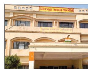
विकास भवन का दृश्य।

● सरकार जरूरतमंद वृद्धों को तिमाही तीन-तीन हजार रुपये की किस्त देती है