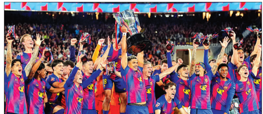
स्पेनिश ला लीगा चैंपियनशिप के साथ जश्न मनाती बार्सिलोना की टीम।

इससे उसने ला लीगा के तीन दौर के मैच शेष रहते हुए रियल मैड्रिड पर 14 अंकों की अजेय बढ़त हासिल कर ली। अब बार्सिलोना की 35 मैच में 91 और रियल मैड्रिड के इतने ही मैच में 77 अंक हैं। बार्सिलोना के कोच हांसी फ्लिक रविवार को खेले गए इस क्लासिको मैच में अपने पिता के निधन के बावजूद डगआउट में मौजूद थे। बार्सिलोना ने मैच शुरू होने से कुछ घंटे पहले ही उनके पिता के निधन की घोषणा की थी। दोनों टीमों के खिलाड़ियों ने काली पट्टी बांधी और मैच शुरू होने से पहले एक मिनट का मौन रखा। अगर यह मैच ड्रा भी हो जाता तो बार्सिलोना के लिए चार