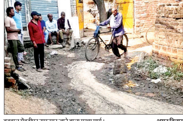
बदहाल मेहदीपुर रामनगर जाने वाला मुख्य मार्ग।