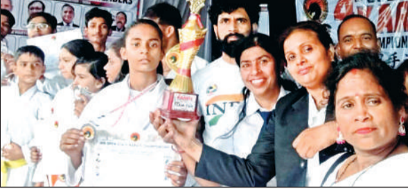
टाफी के साथ विजेता व अन्य।