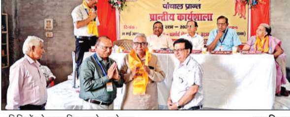
अतिथियों को सम्मानित करते आयोजक।