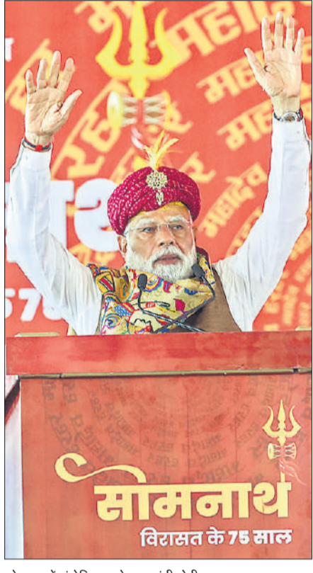
सोमनाथ में संबोधित करते प्रधानमंत्री मोदी।

प्रधानमंत्री ने कहा कि सोमनाथ हमें याद दिलाता है कि कोई भी राष्ट्र तभी लंबे समय तक मजबूत रह सकता है, जब वह अपनी जड़ों से जुड़ा रहे। मोदी ने इस अवसर पर एक विशेष डाक टिकट भी जारी किया। उन्होंने कहा, लुटेरों ने सोमनाथ मंदिर का वैभव मिटाने का प्रयास किया, वे सोमनाथ को एक भौतिक ढांचा मानकर उससे टकराते रहे। बार-बार इस मंदिर को तोड़ा गया, ये बार-बार बनता रहा हर