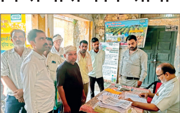
खाद के लिए सचिव को घेरे खड़े लोग।

खेत में तैयार खड़ी मक्का की फसल के लिए किसानों को यूरिया खाद की आवश्यकता है। इसके लिए वह मोहल्ला रामगंज स्थित सहकारी क्रय विक्रय केंद्र और किसान सेवा सहकारी समिति दक्षिणी के चक्कर लगा रहे हैं। सोमवार को भी तमाम किसान पहुंचे तो विक्रय केंद्र पर ईपास मशीन से सर्वर ना आने से उन्हें खाद नहीं