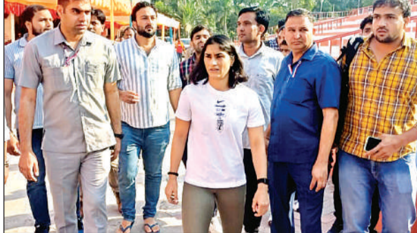
जवाब देने पहुंचीं भारतीय महिला पहलवान विनेश फोगाट।

अमृत विचार। भारतीय महिला पहलवान विनेश फोगाट और डब्ल्यूएफआई के बीच विवाद एक बार फिर गहरा गया है। महासंघ द्वारा घरेलू प्रतियोगिताओं में भाग लेने पर रोक लगाए जाने के बावजूद विनेश राष्ट्रीय ओपन रैंकिंग कुश्ती प्रतियोगिता में हिस्सा लेने के लिए गोंडा पहुंच गई हैं। अयोध्या पहुंचने पर विनेश ने कहा कि वह प्रभु श्रीराम की नगरी में दर्शन करने आई हैं और इसके बाद नंदिनी नगर में आयोजित राष्ट्रीय ओपन रैंकिंग टूर्नामेंट में भाग लेंगी। उन्होंने कहा जो होगा देखा जाएगा। दरअसल, हाल ही में डब्ल्यूएफआई ने विनेश को कारण बताओ नोटिस जारी करते हुए उन पर अनुशासनहीनता और डोपिंग