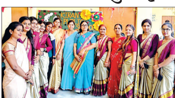
कार्यक्रम में सम्मानित महिलाएं।