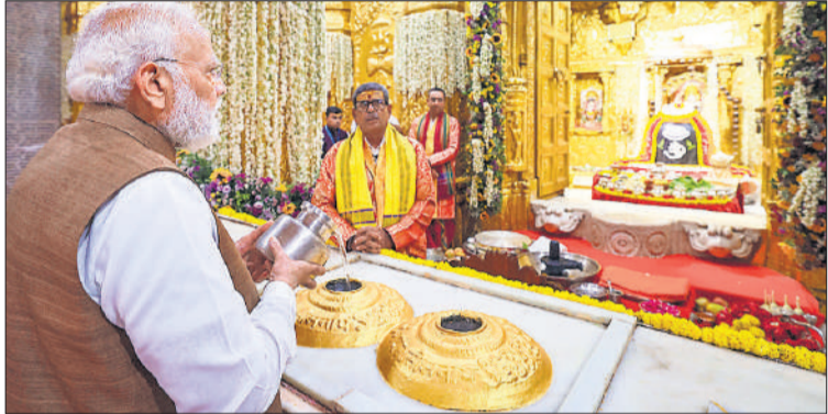
गुजरात के वेरावल स्थित सोमनाथ अमृत महोत्सव मंदिर में प्रार्थना करते प्रधानमंत्री मोदी।

प्रधानमंत्री ने कहा, अगर 1947 में भारत आजाद हुआ था तो, 1951 में सोमनाथ की प्राण प्रतिष्ठा ने भारत की स्वतंत्र चेतना का उद्घोष किया था। मोदी ने कहा कि सोमनाथ का 'अमृत महोत्सव' केवल अतीत का उत्सव नहीं है, यह अगले एक हजार वर्षों के लिए भारत की प्रेरणा का महोत्सव भी है। कहा कि 11 मई केवल सोमनाथ मंदिर के नए