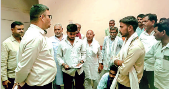
तहसील में समस्या बताते ग्रामीण।

अमृत विचार। जगनेवा गांव की उचित दर की दुकान के चयन को लेकर ग्रामीणों में नाराजगी बढ़ती जा रही है। लगभग एक वर्ष से दुकान निरस्त होने के कारण ग्रामीणों को राशन व्यवस्था में परेशानियों का सामना करना पड़ रहा है। वहीं, तीन बार तिथि निर्धारित होने के बावजूद खुली बैठक में चयन प्रक्रिया पूरी न होने से ग्रामीणों का आक्रोश सोमवार को खुलकर सामने आ गया। सोमवार सुबह बड़ी संख्या में ग्रामीण पंचायत भवन पर उचित दर विक्रेता के चयन की उम्मीद लेकर पहुंचे थे। ग्रामीणों का कहना था कि उन्हें चयन प्रक्रिया होने की जानकारी दी गई थी, लेकिन मौके