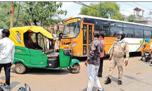
हादसे के बाद हाईवे पर क्षतिग्रस्त खड़ी आपे और बस।