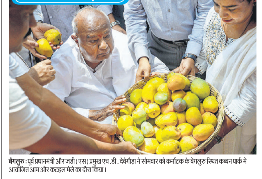
बेंगलुरु: पूर्व प्रधानमंत्री और जड़ी (एस) प्रमुख एच.डी. देवेगौड़ा ने सोमवार को कर्नाटक के बेंगलुरु स्थित कबन पार्क में आयोजित आम और कटहल मेले का दौरा किया।