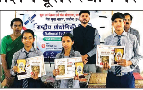
विज्ञान प्रदर्शनी में विजेता छात्र-छात्राओं को किया सम्मानित।

छात्र-छात्राओं ने विज्ञान के विभिन्न विषयों पर आकर्षक एवं नवाचारी मॉडल प्रस्तुत किए। प्रदर्शनी में मुख्य रूप से वाटर रीसाइक्लिंग सिस्टम, स्मार्ट पार्किंग मॉडल, वाटर फिल्टरेशन तकनीक, सोलर पैनल ऊर्जा संरक्षण मॉडल, पर्यावरण संरक्षण आधारित वैज्ञानिक अवधारणाएं