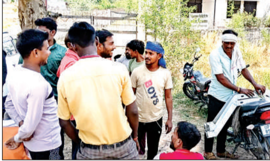
उपकरण लेकर कार्य करने पहुंचे बिजलीकर्मियों।