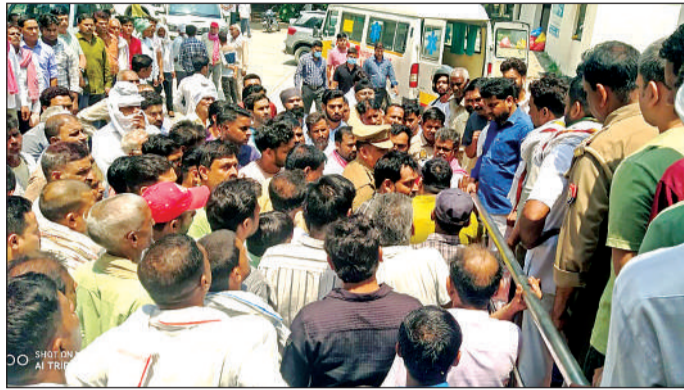
मोर्चरी के बाहर उमड़ी लोगों की भीड़।