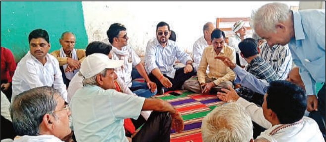
धरना-प्रदर्शन करते अधिवक्ता।

अमृत विचार। सदर तहसील में सोमवार को राजस्व अधिवक्ताओं का गुस्सा खुलकर सामने आ गया। विभिन्न मांगों और तहसील प्रशासन पर लगाए गए गंभीर आरोपों को लेकर अधिवक्ताओं ने अनिश्चितकालीन हड़ताल शुरू कर दी।