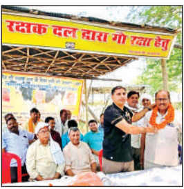
अतिथि का सम्मान करते आयोजक।