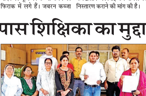
सोमवार को अधिकारियों से मिलने कलेक्ट्रेट पहुंचे पीड़ित शिक्षक।