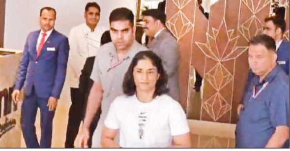
सिविल लाइन स्थित एक होटल से बाहर निकलती महिला पहलवान विनेश फोगाट।

अयोध्या कार्यालय: महिला कुश्ती में भारत का परचम लहराने वाली मशहूर महिला पहलवान विनेश फोगाट ने फिर से रिंग में उतरने की ठान ली है। हरियाणा के जुलाना से विधायक विनेश ने सोमवार को नंदिनीनगर में आयोजित नेशनल ओपन रैसलिंग चैंकिंग टूर्नामेंट में प्रतिभाग करने से पहले अयोध्या में रामलला व हनुमंतलला का आशीर्वाद लिया। इसके पूर्व उन्होंने पत्रकारों से बातचीत करते हुए कहा कि हमने जो मेहनत की है, हमें एक मौका मिलना चाहिए ताकि देश के लिए मेडल जीत सकें। कहा कि प्रभु राम ने उन्हें आशीर्वाद देने के लिए बुलाया है और वह रामलला का आशीर्वाद लेकर नंदिनी नगर