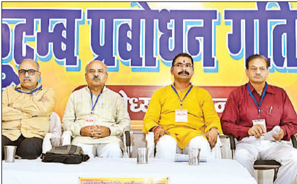
कारसेवकपुरम में आयोजित कुटुंब मिलन समारोह में शामिल आरएसएस के पदाधिकारी।

अमृत विचार : राष्ट्रीय स्वयंसेवक संघ की कुटुंब प्रबोधन गतिविधि अयोध्या महानगर के तत्वावधान में सोमवार को कारसेवकपुरम में कुटुंब मिलन समारोह का आयोजन किया गया। इसमें परिवार संस्था को मजबूत बनाने, पारिवारिक संवाद बढ़ाने और भारतीय संस्कृति के मूल्यों को अपनाने पर विशेष बल दिया गया। साथ ही राष्ट्र विरोधी चैनलों को