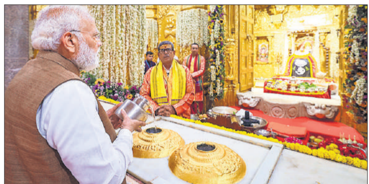
गुजरात के वेरावल स्थित सोमनाथ अमृत महोत्सव मंदिर में प्रार्थना करते प्रधानमंत्री मोदी।

प्रधानमंत्री नरेंद्र मोदी ने सोमवार को 1998 के पोखरण परमाणु परीक्षण का जिक्र करते हुए कहा कि दुनिया की कोई भी ताकत भारत को झुका नहीं सकती या दबाव में नहीं ला सकती है। भगवान शिव के प्रसिद्ध सोमनाथ मंदिर के पुनर्निर्माण के 75 वर्ष पूरे होने के उपलक्ष्य में आयोजित सोमनाथ अमृत महोत्सव में एक सभा को संबोधित करते हुए प्रधानमंत्री ने यह भी कहा कि दुर्भाग्य से देश में ऐसी शक्तियां आज भी प्रभावी हैं, जिन्हें राष्ट्रीय स्वाभिमान से ज्यादा तुष्टीकरण जरूरी लगता है और अयोध्या में राम मंदिर के निर्माण के विरोध के दौरान भी इसी तरह की सोच दिखाई दी थी। प्रधानमंत्री ने कहा, अगर 1947 में भारत आजाद हुआ था तो, 1951 में सोमनाथ की प्राण प्रतिष्ठा ने भारत की स्वतंत्र चेतना का उद्घोष किया था। मोदी ने कहा कि सोमनाथ का 'अमृत महोत्सव' केवल अतीत का उत्सव नहीं है, यह अगले एक हजार वर्षों के लिए भारत की प्रेरणा का महोत्सव भी है। कहा कि 11 मई केवल सोमनाथ मंदिर के नए