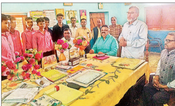
विद्यार्थियों को उच्च शिक्षा के बारे में जानकारी देती शिक्षकों की टीम।