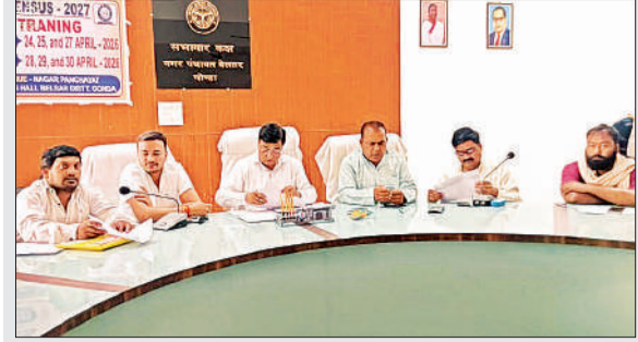
बैठक करते शक्ति केंद्र संयोजक।