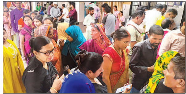
जिला अस्पताल में पार्वा कांटेक्टर पर जुटी मरीजों की भीड़। अमृत विचार

अमृत विचार : जिला अस्पताल में इकलौते फिजिशियन के छुट्टी पर जाते ही व्यवस्था लड़खड़ा गई है। मरीज भटक रहे हैं। आलम यह रहा कि सोमवार का 550 से भी अधिक मरीज सिर्फ फिजिशियन को दिखाने के लिए पंजीकृत हुए थे, लेकिन जब वे ओपीडी में गए तो उनमें से कई को बैरंग लौटना पड़ा। कई ने दूसरे चिकित्सक के पास जाकर दवाएं लीं। जिला अस्पताल में वर्षों से चिकित्सकों का टोटा चल रहा है। सुजित पद के भी अपेक्षित चिकित्सक नहीं हैं।