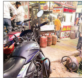
रेस्टोरेंट पर हो रहा घरेलू गैस का प्रयोग।

तहसील क्षेत्र में घरेलू गैस सिलेंडरों का खुलेआम व्यावसायिक उपयोग होने से आम उपभोक्ताओं के सामने गैस संकट गहराता जा रहा है। होटल, ढाबों और ठेलों पर सिलेंडर वाले घरेलू सिलेंडर धड़ल्ले से इस्तेमाल किए जा रहे हैं। उपभोक्ताओं का आरोप है कि बुकिंग के बाद भी 7 से 10 दिन तक सिलेंडर नहीं मिल रहा।