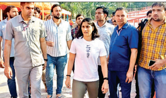
जवाब देने पहुंचीं भारतीय महिला पहलवान विनेश फोगाट।

अमृत विचार। भारतीय महिला पहलवान विनेश फोगाट और डब्ल्यूएफआई के बीच विवाद एक बार फिर गहरा गया है। महासंघ द्वारा घरेलू प्रतियोगिताओं में भाग लेने पर रोक लगाए जाने के बावजूद विनेश राष्ट्रीय ओपन रैंकिंग कुश्ती प्रतियोगिता में हिस्सा लेने के लिए गोंडा पहुंच गई हैं। अयोध्या पहुंचने पर विनेश ने कहा कि वह प्रभु श्रीराम की नगरी में दर्शन करने आई हैं और इसके बाद नंदिनी नगर में आयोजित राष्ट्रीय ओपन रैंकिंग टूर्नामेंट में भाग लेंगी। उन्होंने कहा जो होगा देखा जाएगा। दरअसल, हाल ही में डब्ल्यूएफआई ने विनेश को कारण बताओ नोटिस जारी करते हुए उन पर अनुशासनहीनता और डोपिंग