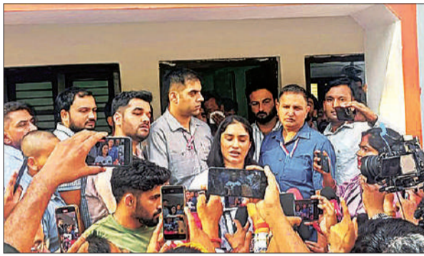
मीडिया से बात करती पहलवान विनेश फोगाट।

नंदिनी नगर पहुंचते ही विनेश फोगाट सीधे महाविद्यालय परिसर में बने डब्ल्यूएफआई कार्यालय पहुंचीं, जहां उन्होंने अधिकारियों से मुलाकात कर प्रतियोगिता में भागीदारी को लेकर चर्चा की। करीब 17 मिनट तक चली बातचीत के बाद बाहर निकलीं विनेश ने मीडिया से बातचीत में कहा कि उन्हें प्रतियोगिता में खेलने की अनुमति नहीं दी जा रही है। मीडिया से बातचीत के दौरान विनेश फोगाट ने नंदिनी नगर में चल रही कुश्ती प्रतियोगिता की व्यवस्थाओं पर गंभीर