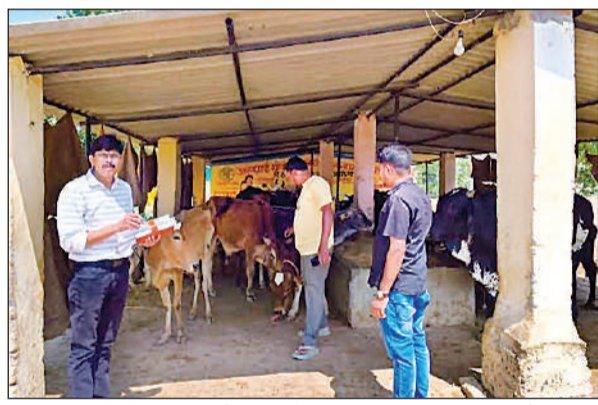
रामपुर सरधा में गोशाला का निरीक्षण करते उप मुख्य पशु चिकित्सा अधिकारी।