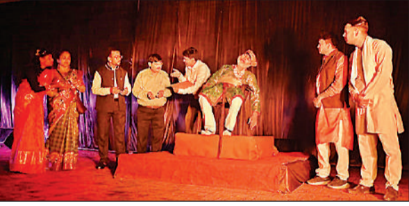
कलाकारों ने चर्चित नाटक ताजमहल का टेंडर का जीवंत मंचन किया।