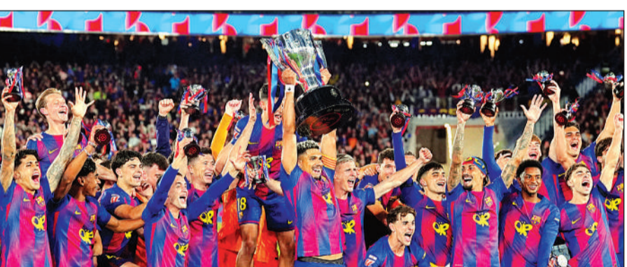
स्पेनिश ला लीगा चैंपियनशिप के साथ जश्न मनाती बार्सिलोना की टीम।

इससे उसने ला लीगा के तीन दौर के मैच शेष रहते हुए रियाल मैड्रिड पर 14 अंकों की अजेय बढ़त हासिल कर ली। अब बार्सिलोना की 35 मैच में 91 और रियाल मैड्रिड के इतने ही मैच में 77 अंक हैं। बार्सिलोना के कोच हांसी फ्लिक रविवार को खेले गए इस क्लासिको मैच में अपने पिता के निधन के बावजूद डगआउट में मौजूद थे। बार्सिलोना ने मैच शुरू होने से कुछ घंटे पहले ही उनके पिता के निधन की घोषणा की थी। दोनों टीमों के खिलाड़ियों ने काली पट्टी बांधी और मैच शुरू होने से पहले एक मिनट का मौन रखा। आयर यह मैच ड्रां भी हो जाता तो बार्सिलोना के लिए चार