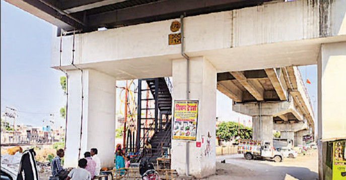
फतेहगंज ओवरब्रिज के नीचे खाली पड़ा स्थान। अमृत विचार

फतेहगंज ओवरब्रिज के नीचे विकसित होने वाले गार्डन में हरे-भरे लॉन, आकर्षक फूलों की ब्यारियां, वॉकिंग ट्रैक और बैठने की व्यवस्था होगी। बच्चों के लिए अलग से खेल क्षेत्र बनाया जाएगा। जिसमें झूले, स्लाइड जैसे आधुनिक खेल उपकरण लगाए जाएंगे। युवाओं के लिए बास्केटबॉल, बैडमिंटन कोर्ट का निर्माण किया जाएगा। स्वास्थ्य के प्रति जागरूक