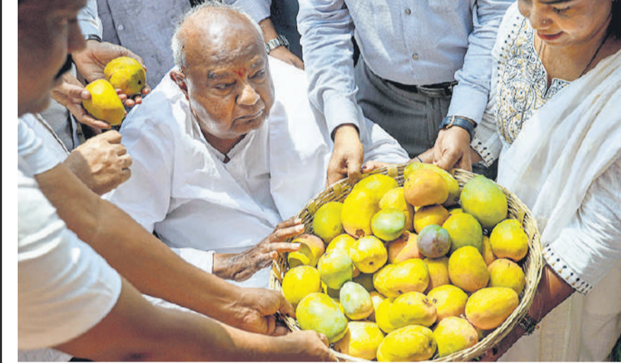
बंगलुरु: पूर्व प्रधानमंत्री और जड़ी (एस) प्रमुख एच.डी. देवेगौड़ा ने सोमवार को कर्नाटक के बंगलुरु स्थित कबन पार्क में आयोजित आम और कटहल मेले का दौरा किया।