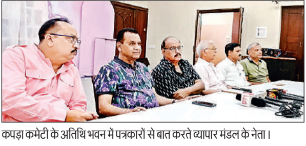
कपड़ा कमेटी के अतिथि भवन में पत्रकारों से बात करते व्यापार मंडल के नेता।