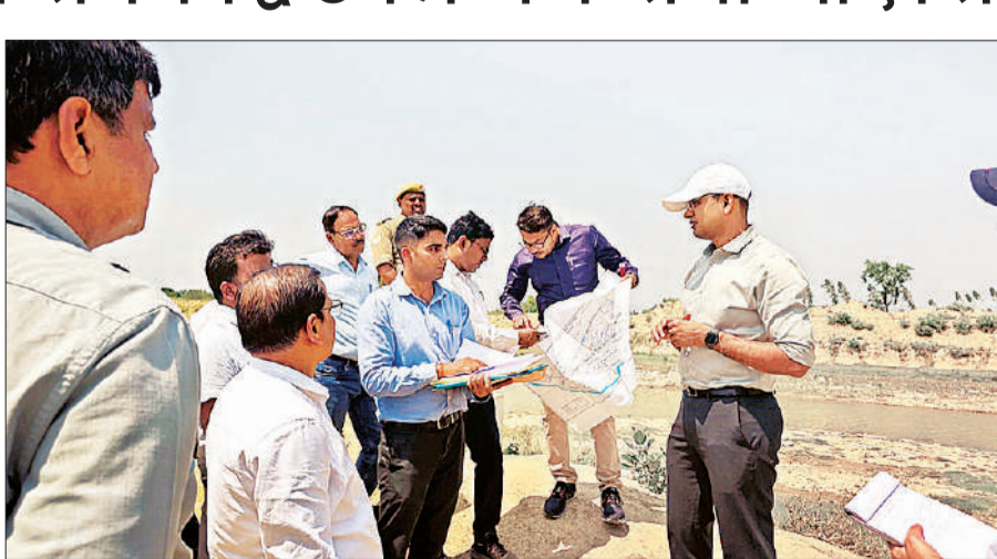
राप्ती नहर का निरीक्षण करते डीएम और अन्य अधिकारी। ● अमृत विचार

अमृत विचार : आगामी खरीफ सीजन को देखते हुए जिलाधिकारी विपिन कुमार जैन ने सोमवार को विकासखंड हरैया सतघरवा क्षेत्र में राप्ती मुख्य नहर का निरीक्षण कर सिंचाई व्यवस्था का जायजा लिया। निरीक्षण के दौरान उन्होंने किलोमीटर 45 से 50 के मध्य नहर से संचालित कुलाबों और गुलों की स्थिति की समीक्षा करते हुए किसानों को समयबद्ध सिंचाई सुविधा उपलब्ध कराने के निर्देश दिए।