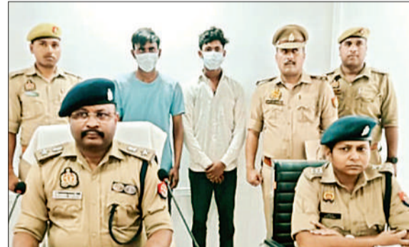
हत्या के गिरफ्तार आरोपियों के साथ अपर पुलिस अधीक्षक व पुलिस टीम।

अमृत विचार : थाना गौरा चौराहा क्षेत्र में अनार तोड़ने के मामली विवाद ने खूनी रूप ले लिया। पुरानी रंजिश और गाली-गलौज से नाराज आरोपियों ने एक किशोर की हत्या कर दी। मामले का खुलासा करते हुए पुलिस ने दो आरोपियों को गिरफ्तार कर न्यायालय भेज दिया है।