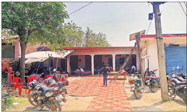
दूल्हे की मौत के बाद उसके घर पर पसरा सन्नाटा।

अमृत विचार : स्थानीय थाना क्षेत्र के अंतर्गत ग्राम मैनहवा में शादी की खुशी मातम में उस वक्त बदल गई जब बहू भोज के दिन सड़क दुर्घटना में दूल्हे की मौत की सूचना घर पर पहुंची। इस हादसे से पूरे गांव में सन्नाटा पसरा। सहज राम प्रमोद फाइल फोटो।