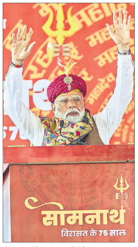
सोमनाथ में संबोधित करते प्रधानमंत्री मोदी।

जड़ों से जुड़ा रहने वाला राष्ट्र लंबे समय तक रहता मजबूत प्रधानमंत्री ने कहा कि सोमनाथ हमें याद दिलाता है कि कोई भी राष्ट्र तभी लंबे समय तक मजबूत रह सकता है, जब वह अपनी जड़ों से जुड़ा रहे। मोदी ने इस अवसर पर एक विशेष डाक टिकट भी जारी किया। उन्होंने कहा, लुटेरों ने सोमनाथ मंदिर का वैभव मिटाने का प्रयास किया, वे सोमनाथ को एक भौतिक ढांचा मानकर उससे टकराते रहे। बार-बार इस मंदिर को तोड़ा गया, ये बार-बार बनता रहा हर बार उठ खड़ा होता रहा।