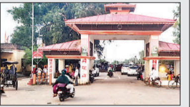
भारत-नेपाल सीमा पर बने रास्ते निकलते राहगीर।

रूपईडीहा (बहराइच)। पड़ोसी मित्र राष्ट्र नेपाल में नई सरकार के गठन के बाद भारत-नेपाल सीमा पर कस्टम नियमों को लेकर सख्ती काफ़ी बढ़ गई है। नेपाल सरकार के आदेश पर भारत से नेपाल ले जाए जाने वाले 100 नेपाली रुपये से अधिक मूल्य के सामान पर कस्टम शुल्क लागू किए जाने से सीमावर्ती नेपाली क्षेत्रों में रहने वाले लाखों लोग प्रभावित हो रहे हैं। इस फैसेले के बाद नेपाल के सीमावर्ती नागरिकों में नाराजगी बढ़ती जा रही है। स्थानीय लोगों के अनुसार इससे पहले नेपाल सरकार द्वारा नेपाली नागरिकों को भारत से दैनिक उपयोग के सामान लाने में पर्याप्त छूट दी जाती थी। लेकिन नई सरकार बनने के बाद पुराना नियम सख्ती से लागू कर दिया गया, जिसके तहत मात्र 100 रु0 नेपाली तक के सामान को ही बिना शुल्क ले जाने की अनुमति है। बताया जाते है कि यह नियम करीब 35 वर्ष पहले बनाया गया था, जब 100 नेपाली रुपये की क्रय शक्ति काफी अधिक थी। वर्तमान समय में बढ़ती महंगाई के बावजूद इस सीमा में कोई बदलाव नहीं किया गया है। सीमावर्ती नेपाली नागरिकों का कहना है कि अब उन्हें रोजमर्रा के उपयोग की वस्तुएं नेपाल में कई गुना अधिक कीमत पर खरीदनी पड़ रही हैं, जिससे गरीब और मध्यम वर्गीय परिवारों का घरेलू बजट पूरी तरह प्रभावित हो गया है।