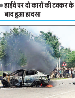
धू-धूकर जलती कार।

अमृत विचार। लखनऊ-बहराइच राजमार्ग पर स्थित फखरपुर थाना क्षेत्र में सोमवार की दोपहर दो कारों की आमने सामने टक्कर हो गई, हादसे के बाद एक कार में आग लग गई। आस पास के लोगों ने दोनों कारों में फंसे यात्रियों को सुरक्षित बाहर निकाल लिया, दुर्घटना में वाहन सवार छह लोग घायल हुए हैं। सभी को इलाज के लिए स्थानीय स्वास्थ्य केंद्र में भर्ती कराया गया है।