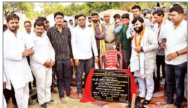
बीकापुर के ग्राम में उत्सव भवन का शिलान्यास करते विधायक डॉ. अमित सिंह चौहान।

अमृत विचार : बीकापुर विधानसभा अंतर्गत खजुरहत ग्राम पंचायत में 1.41 करोड़ की लागत से निर्मित होने वाले उत्सव भवन के निर्माण कार्य का सोमवार को विधायक डॉ. अमित सिंह चौहान ने भूमि पूजन एवं शिलान्यास किया। अयोध्या-प्रयागराज हाईवे से कुछ दूरी पर प्रस्तावित यह भवन अयोध्या जनपद का इकलौता उत्सव भवन होगा। विधायक ने बताया कि खजुरहत ग्राम पंचायत में प्रस्तावित उत्सव भवन शासन द्वारा ग्राम पंचायत को दी गई सौभाग्य है। कार्य योजना को मूर्ति रूप देने के लिए जिलाधिकारी की अध्यक्षता में छह सदस्यीय