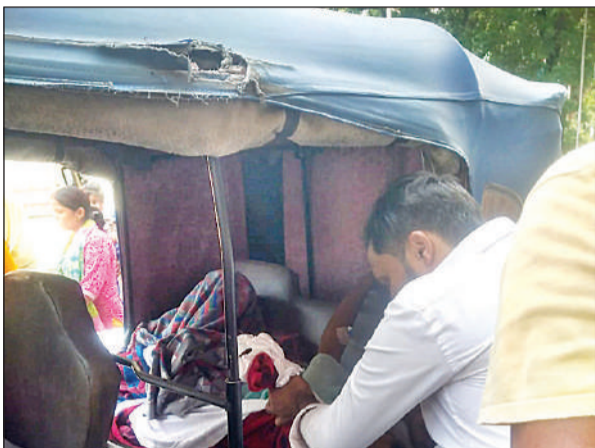
ऑटो में मरीज को बैठाते तीमारदार।