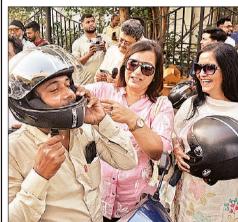
बाइक चालक को हेलमेट पहनाती स्वयं सेवक।