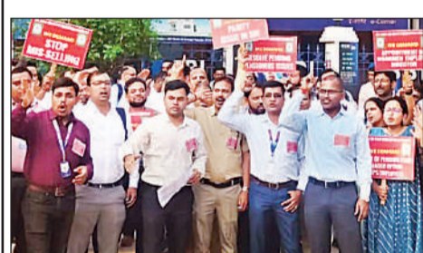
नारेबाजी करते बैंक कर्मचारी।