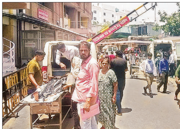
धूप में खड़ी एंबुलेंस और स्ट्रेचर पर तपते मरीज।

अमृत विचार, लखनऊ : किंग जॉर्ज चिकित्सा विश्वविद्यालय (केजीएमयू) के ट्रॉमा सेंटर में मरीजों और उनके तीमारदारों को बुनियादी सुविधाओं के अभाव में भारी परेशानी का सामना करना पड़ रहा है। ट्रॉमा सेंटर में आने वाली एंबुलेंस के ठहराव स्थल पर छाया की कोई समुचित व्यवस्था न होने के कारण गंभीर हालत में लाए गए मरीजों को भीषण धूप में ही स्ट्रेचर और एंबुलेंस में इंतजार करना पड़ रहा है। तीमारदारों का कहना है कि आपात स्थिति में लाए जाने वाले मरीज पहले से ही नाजुक हालत में होते हैं, ऐसे में तेज धूप उनकी स्थिति को और बिगाड़ सकती है। बावजूद इसके, ट्रॉमा सेंटर परिसर में न तो शेड लगाए गए हैं और न ही किसी अस्थायी छाया की व्यवस्था की गई है। जबकि, हर साल गर्मियों में केजीएमयू की ओर से छाया के इंतजाम किए जाते रहे हैं। यह स्थिति सिर्फ मरीजों तक सीमित नहीं है, बल्कि उनके साथ आने वाले तीमारदारों को भी कोई राहत नहीं मिल रही है। धूप से बचने के लिए उन्हें खुले में इधर-उधर भटकना पड़ता है, जिससे उनकी परेशानी और बढ़ जाती है। ट्रॉमा सेंटर जैसे आपातकालीन और संवेदनशील विभाग में इस तरह की अव्यवस्था ने प्रशासनिक तैयारियों पर भी सवाल खड़े कर दिए हैं। मरीजों और परिजनों ने जल्द से जल्द स्थायी और प्रभावी छाया व्यवस्था किए जाने की मांग की है, ताकि भविष्य में इस तरह की स्थिति से बचा जा सके। केजीएमयू के प्रवक्ता डॉ. केके सिंह का कहना है कि ट्रॉमा के विस्तार को लेकर निर्माण कार्य चल रहा है। जिसके कारण कुछ अव्यवस्थाएं जरूर हैं। लेकिन एंबुलेंस के ठहराव स्थल पर जल्द ही स्थायी छाया की व्यवस्था की जाएगी।