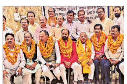
बैठक में मौजूद कायस्थ समाज के पदाधिकारी।