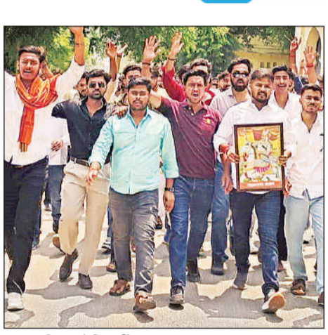
महाराणा प्रताप जयंती पर छात्रों ने निकाली पदयात्रा