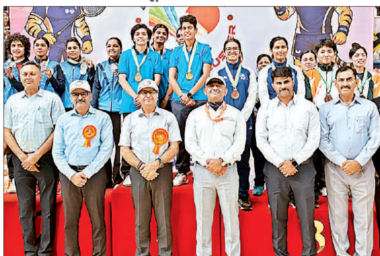
अमृत विचार महिला वर्ग में दूसरा स्थान हासिल करने वाली पुलिस टीम।