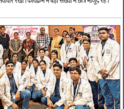
कार्यक्रम में शामिल प्रतिभागी।