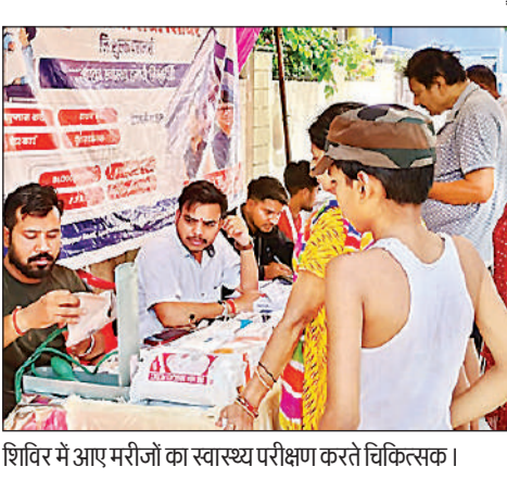
शिविर में आप मरीजों का स्वास्थ्य परीक्षण करते चिकित्सक।