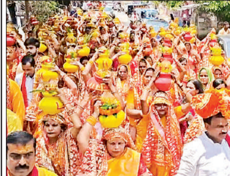
कलश यात्रा में शामिल श्रद्धालु।