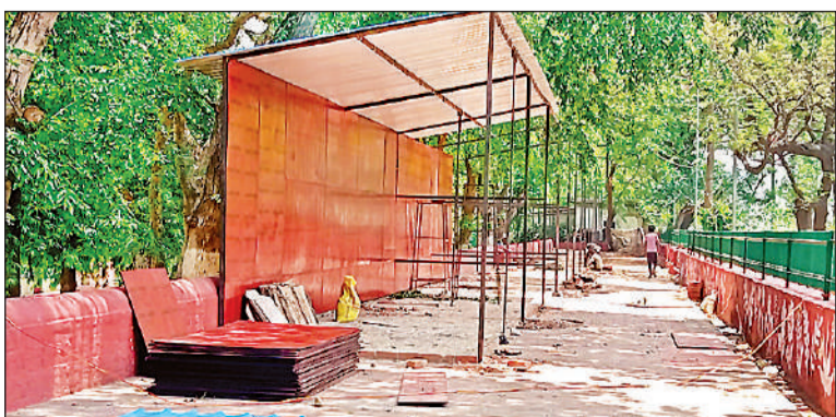
शहीद स्मारक पर लखनऊ हॉट के लिए तैयार किए जाते स्टॉल।

शहीद स्मारक की सीढियां चढ़ने के बाद दोनों ओर बने विशाल चबूतरों पर लखनऊ हाट बनाने की तैयारी चल रही है। खाने के स्टाल के लिए 135 वर्ग फीट का स्टाल होगा। इसके लिए 5 लाख रुपये सेक्योरिटी जमा करानी होगी और 55 हजार रुपये महीना किराया अदा करना होगा। हस्तशिल्प का स्टाल 155 वर्ग फीट का होगा। इसके लिए साढ़े 6 लाख रुपये सेक्योरिटी का जमा करानी होगी और किराया 65 हजार रुपये महीना होगा। लखनऊ हाट में दुकानदारों के लिए