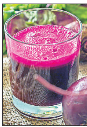
एक समूह को चुकंदर के रस से कुल्ला कराया गया, जबकि दूसरे समूह को सामान्य दवाएं दी गईं। एक सप्ताह बाद किए गए मूल्यांकन में पाया गया कि दोनों

समूहों में सूजन में लगभग समान कमी आई। हालांकि, बैक्टीरिया की संख्या को लंबे समय तक नियंत्रित रखने में दवाएं अधिक प्रभावी साबित हुईं।