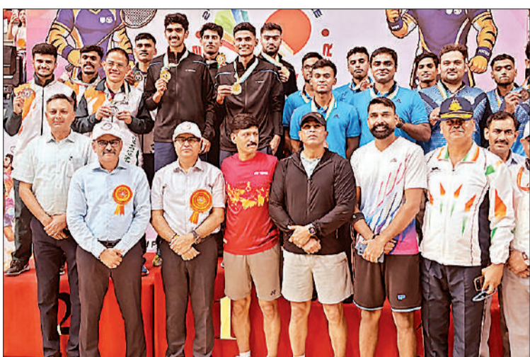
पुरुष वर्ग में तीसरा स्थान हासिल करने वाली यूपी पुलिस की टीम।