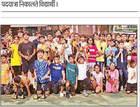
ट्रॉफी के साथ विजयी खिलाड़ी।