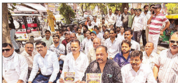
घरने पर बैठे लखनऊ महानगर सर्राफा एसोसिएशन व ऑल इंडिया ज्वेलर्स एंड गोल्डस्मिथ फेडरेशन के सदस्य।