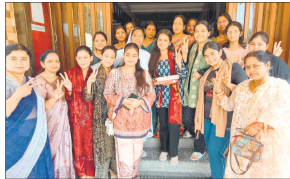
सेंट मेरी स्कूल में परिणाम आने के बाद खुशी जताती छात्राएं।