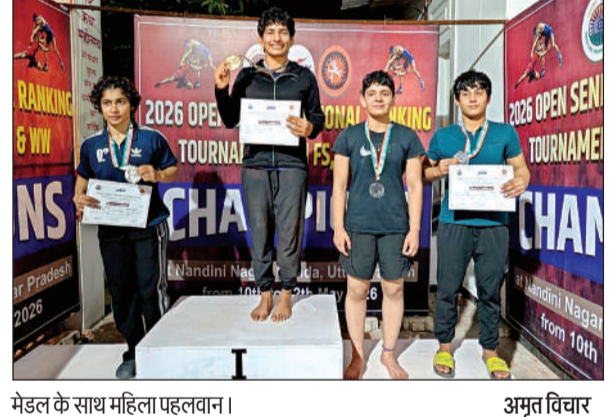
मेडल के साथ महिला पहलवान।

अमृत विचार। नंदिनी नगर स्पोर्ट्स स्टेडियम में आयोजित ओपन सीनियर नेशनल रैंकिंग कुरुती प्रतियोगिता का मंगलवार देर शाम को पदक अलंकरण समारोह के साथ समापन हो गया। देशभर से पहुंचे पहलवानों के बीच हुए रोमांचक मुकाबलों में हरियाणा के खिलाड़ियों ने शानदार प्रदर्शन करते हुए प्रतियोगिता पर अपना दबदबा कायम रखा।