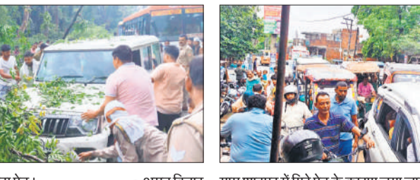
ग्राम शाहपुर में गिरे पेड़ के कारण लगा जाम।

थे। अचानक आंधी के कारण उनकी गाड़ी पर पेड़ गिर गया। लेकिन कोई भी जनहानि नहीं हुई है। लेकिन पेड़ गिरने से गजरोला मार्ग पर लंबा जाम लग गया। जाम लगने की सूचना पर कोतवाली पुलिस मौके पर पहुंची और गिरे हुए पेड़ को कटवा कर साइड से करवाया तब जाकर कई घंटे की मेहनत के बाद यातायात शुरू हुआ। वहीं नगर के अलीगढ़ मार्ग पर स्थित गाव शाहपुर कला में सड़क के किनारे पिलखन का पेड़ सड़क पर गिर गया जिससे मार्ग पर यातायात प्रभावित हो गया और लगभग डेढ़ घंटे तक बाधित रहा। काफी देर के बाद ग्रामीणों एवं पुलिस की मेहनत