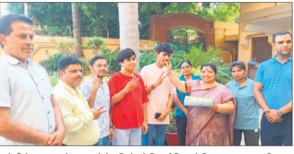
चंदौसी के आरआरके स्कूल में मेधावियों को मिठाई खिलाते शिक्षक।