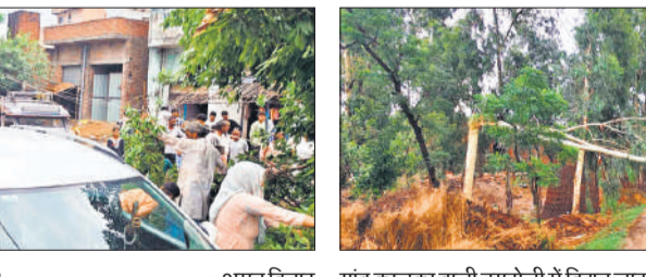
गांव कालका वाली डगरोली में विद्युत लाइन पर गिरा पेड़।