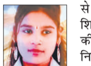
मौत का काजल।

अमृत विचार : कटघर कोतवाली के पीतलनगरी में विवाहिता की संदिग्ध परिस्थितियों में मौत हो गई। विवाहिता का शव घर के कमरे की छत में बने कुंडे से कपड़े के फंदे पर लटका मिला। इसकी जानकारी पर आसपास के लोग मौके पर जुट गए। सूचना