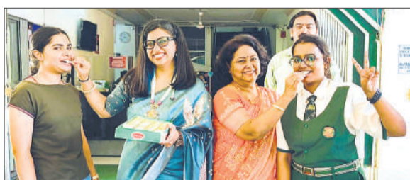
एस एस चिल्ड्रन एकेडमी में टॉपर्स को मिठाई खिलाती प्रधानाचार्य।