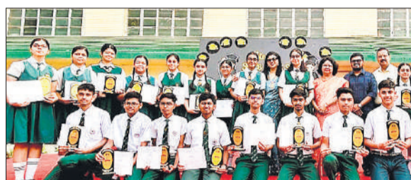
रिजल्ट आने के बाद एस एस चिल्ड्रन एकेडमी में छात्र छात्राएं प्रधानाचार्य के साथ।