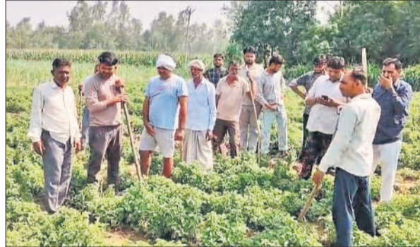
मौके पर एकत्र ग्रामीण।

● अमृत विचार ग्रामीणों ने तत्काल इसकी सूचना पुलिस और वन विभाग को दी। सूचना मिलते ही वन विभाग की टीम और थाना सैदनगली पुलिस मौके पर पहुंच गई। ग्रामीण इस बात पर अड़े हैं कि जब तक तेंदुए को पिंजरा लगाकर पकड़ा नहीं जाता, वे पीछे नहीं हटेंगे। ग्रामीणों का आरोप है कि तेंदुए की मौजूदगी से किसान खेतों पर जाने से डर रहे हैं और जान का खतरा बना हुआ है। फिलहाल, वन विभाग की टीम रेस्क्यू ऑपरेशन की तैयारी में जुटी है और लोगों को सुरक्षित दूरी बनाए रखने की हिदायत दी गई है।