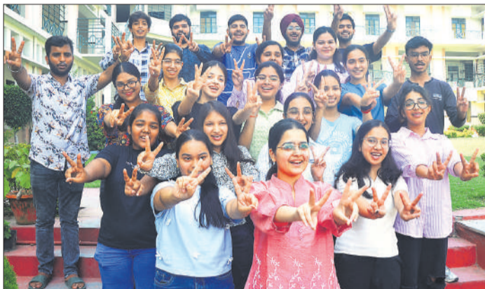
सीबीएसई इंटर का रिजल्ट आने पर बरेली के एक स्कूल में खुशी से झूमने लगे।

केंद्रीय माध्यमिक शिक्षा बोर्ड ने बुधवार को 12वीं कक्षा के परीक्षा परिणाम घोषित कर दिए। इस साल कुल 85 प्रतिशत से अधिक विद्यार्थियों ने परीक्षा उत्तीर्ण की है। हालांकि, पिछले साल के मुकाबले इस बार उत्तीर्ण प्रतिशत में तीन फीसदी से ज्यादा की गिरावट दर्ज की गई है। परीक्षा