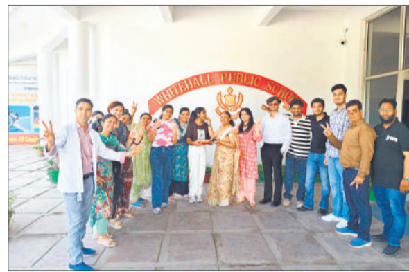
कामना की। विद्यार्थियों ने अपनी इस सफलता का श्रेय अपने माता-पिता और शिक्षकगण को देते हुए सभी का आभार व्यक्त किया।