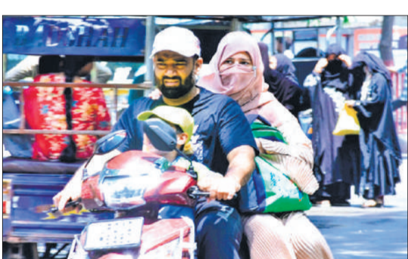
धूप के दौरान मुंह ढँककर निकले लोग।

अमृत विचार : जिले में बुधवार सुबह मौसम ने अचानक करवट ली। सुबह से ही आसमान में काले बादलों का डेरा छा गया, जिससे दिन में भी शाम जैसा दृश्य दिखाई देने लगा। तेज हवा और धूल भरी आंधी के कारण शहर की रफ्तार कुछ देर के लिए धीमी पड़ गई। राहगीरों और दोपहिया वाहन चालकों को काफी दिक्कतों का सामना करना पड़ा। बचाव के लिए लोगों को दुकानों और शॉप का सहारा लेना पड़ा।