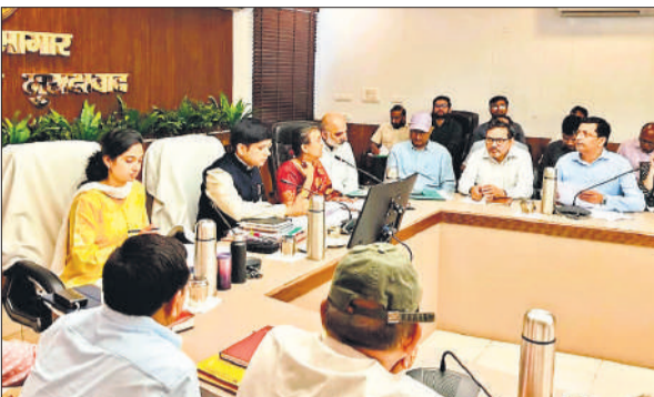
विकास भवन सभागार में सीएम डैशबोर्ड की बैठक में प्रगति की समीक्षा करते जिलाधिकारी।

जिलाधिकारी ने सीएम डैशबोर्ड के अंतर्गत विभिन्न विभागों की योजनाओं की प्रगति की जानकारी अधिकारियों से ली। कहा जिन योजनाओं में जिले की प्रगति संतोषजनक नहीं है उनसे संबंधित अधिकारी गंभीरता दिखाएं और यह सुनिश्चित करें कि किसी भी स्तर पर लापरवाही न हो। उन्होंने आईजीआरएस पोर्टल पर प्राप्त