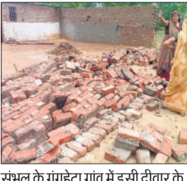
संभल के गंगहेटा गांव में इसी दीवार के मलबे में दबकर हुई ग्रामीणी की मौत।