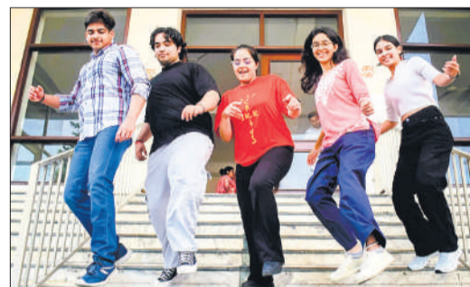
पी एम एस स्कूल में खुशी मनाते छात्र छात्राएं।

मुरादाबाद, अमृत विचार : सेंट्रल बोर्ड ऑफ सेकेंडरी एजुकेशन (सीबीएसई) 12वीं का परिणाम बुधवार दोपहर जारी हुआ। जैसे ही सीबीएसई की वेबसाइट पर रिजल्ट अपलोड किया गया छात्र-छात्राओं ने मोबाइल और लैपटॉप पर अपने अंक देखने शुरू कर दिए। अंकों के आते ही मेधावियों के चेहरे खिल गए। वह परिवार के साथ खुशियां मनाने लगे। स्कूल में पहुंचे छात्रों ने एक दूसरे को बधाई देकर मिठाई खिलाकर जश्न मनाया। इस वर्ष जिले के 18 परीक्षा केंद्रों पर सीबीएसई 12वीं की परीक्षा में 4,898 परीक्षार्थी शामिल हुए थे। परीक्षा समाप्त होने के बाद से ही विद्यार्थियों ने परिणाम को लेकर उत्सुकता बनी थी। बुधवार को रिजल्ट जारी होने के साथ ही स्कूलों, कॉचिंग संस्थानों और साइबर कफे के बाहर हलबल बढ़ गई। कई अभिभावक बच्चों के साथ बैठकर रिजल्ट देखने में जुटे रहे। अंकों के प्राप्त करने वाले विद्यार्थियों के घरों पर रिश्तेदारों और परिचितों का बधाई देने के लिए आना-जाना लगा रहा। शिक्षकों ने भी विद्यार्थियों की मेहनत और अनुशासन की सराहना की। शहर के कई विद्यालयों ने अपने टॉपर विद्यार्थियों की सूची जारी की। स्कूल प्रबंधन की ओर से मेधावी छात्रों के सम्मान समारोह की तैयारियां भी शुरू हो गई हैं। रिजल्ट आने के बाद सफल विद्यार्थी आगे की पढ़ाई और भविष्य का ताना बना बुनने में जुट गए।