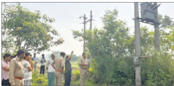
मौके पर जांच पड़ताल करती पुलिस व विद्युत विभाग की टीम।