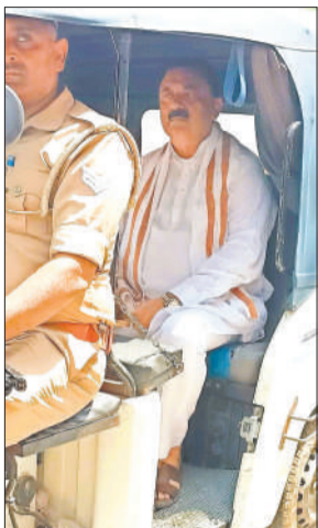
ई रिक्शा से जाते भाजपा महानगर अध्यक्ष।

अमेरिका-ईरान युद्ध के चलते पश्चिम एशिया में गहराई ईंधन संकट और अन्य वस्तुओं की बढ़ती कीमतों को देखते हुए दो दिन पहले प्रधानमंत्री नरेंद्र मोदी से देश की जनता से ईंधन का अपव्यय रोकने, एक साल तक शादी विवाह या अन्य किसी आयोजन के लिए सोने के आभूषण न खरीदने, बैटकों को वंचुअल करने आदि की अपील की थी। इसके बाद मुख्यमंत्री