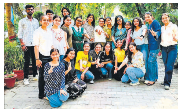
एसएस चिल्ड्रन एकेडमी में रिजल्ट के बाद खुशी मनाते छात्र छात्राएं।