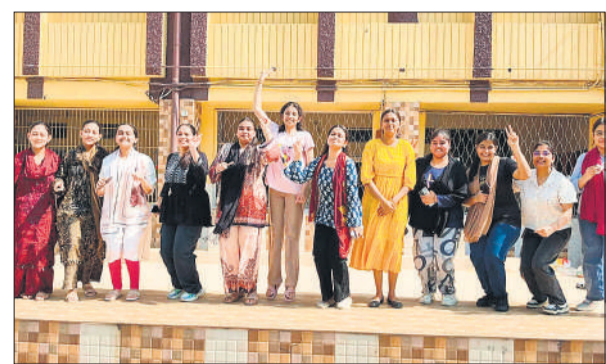
परिणाम के बाद खुशी जताती छात्राएं।