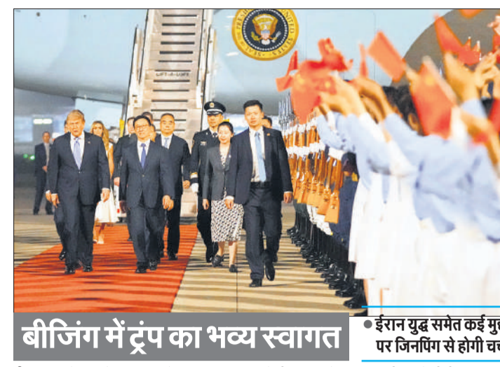
बीजिंग में ट्रंप का भव्य स्वागत ● ईरान युद्ध समेत कई मुद्दों पर जिनपिंग से होगी चर्चा

अमेरिका के रक्षा मंत्री पीट हेगसेथ ने कहा कि ईरान युद्ध में अमेरिका के हथियारों का भंडार खाली होने की रिपोर्ट और राजनीतिक दावे मूर्खतापूर्ण हैं और व्यर्थ में बढ़ा-चढ़ाकर पेश किए गए हैं। हेगसेथ ने ईरान युद्ध के खर्च पर आयोजित संसदीय सुनवाई में इन दावों को सिर से खारिज किया। हेगसेथ ने सदन विनियोग रक्षा उपसमिति के सामने कहा कि पश्चिम एशिया में जारी तनाव से संबंधित मांग बढ़ने के बावजूद अमेरिकी सेना की पूरी परिचालन क्षमता बरकरार है। हेगसेथ ने कहा कि अमेरिकी सेना के पास अपने अधिन्यायों को अंजाम देने के लिए आवश्यक सभी हथियार और गोला-बारूद उपलब्ध हैं। उन्होंने उन रिपोर्टों को खारिज किया जिनमें कहा गया था कि रक्षा मंत्रालय महत्वपूर्ण हथियार प्रणालियों की कमी का सामना कर रहा है। हेगसेथ ने संसदों के साथ अलग बातचीत में कहा, मैं सार्वजनिक मंच पर यह कहें जाने से असहमत हूँ कि हमारे गोला-बारूद के भंडार समाप्त हो रहे हैं। ईरान संघर्ष कई सप्ताह तक खिंचने के कारण हथियार भंडार को लेकर चिंताएं बढ़ गई हैं। इस दौरान टॉमहॉक क्रूज मिसाइल, एटीएसीएमएस युद्धक्षेत्र मिसाइल और पैट्रियट वायु रक्षा इंटरसेप्टर जैसी उन्नत प्रणालियों का बड़े पैमाने पर इस्तेमाल हुआ है।