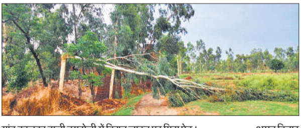
गांव कालका वाली डगरोली में विद्युत लाइन पर गिरा पेड़।

बारिश से नगर में जलभराव, निकलने में हुई दिक्कतें हसनपुर, अमृत विचार : नगर में आंधी के साथ हुई बारिश से जनजीवन अस्त-व्यस्त हो गया। नगर की सड़क व गली मोहल्लों समेत सरकारी कार्यालयों में जलभराव हो गया। जिससे लोगों को निकलने में काफी दिक्कतों का सामना करना पड़ा। नाले व नालियां ओवरफ्लो होने की वजह से पानी भर गया। बारिश ने नगर पालिका द्वारा कराई जाने वाली साफ-सफाई की पोल खोल कर रख दी। बुधवार को तेज आंधी के साथ आई बारिश से नगर के मुख्य मार्गों सहित कई मोहल्ले में जल भराव की समस्या से नगर वारिसों को दिक्कतों का सामना करना पड़ा और काफी परेशानी उठानी पड़ी। बारिश के चलते नगर के रेरा अड्डे पर स्थित अलीगढ़ मार्ग पर पानी भरने से यातायात प्रभावित रहा और वहीं व्यापारियों को भी परेशानियों का सामना करना पड़ा। नगर की पुरानी सच्ची मंडी मार्ग पर भी बरसात का पानी भरने से जहां नगर वारिसों को परेशानी उठानी पड़ी वहीं व्यापारियों को भी काफी दिक्कतें उठानी पड़ी। इसके अलावा नगर के मोहल्ला कायस्थान, मोहल्ला महल, मोहल्ला होली बाला, लाल बाग, आंखुन चौक आदि स्थानों पर भी बारिश का पानी भरने से मोहल्ला वारिसों को दिक्कतें उठानी पड़ी। इसके अलावा नगर स्थित सरकारी कार्यालय में भी बरसात का पानी जमा हो गया था।