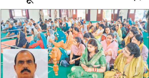
संत निरंकारी भवन में सत्संग करते प्रचारक।

संवाददाता, ठाकुरद्वारा अमृत विचार : संत निरंकारी मिशन के तत्वावधान में मंगलवार को निरंकारी सत्संग भवन में मिशन के पूर्व सतगुरु बाबा हरदेव सिंह जी महाराज की पुण्यतिथि श्रद्धा और भक्ति भाव के साथ समर्पण दिवस के रूप में मनाई गई। कार्यक्रम में बड़ी संख्या में श्रद्धालुओं ने हिस्सा लेकर सतगुरु के बताए मानवता, प्रेम और सेवा के मार्ग पर चलने का संकल्प लिया।