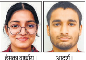
हेमका वाण्य। आदर्श।

अमृत विचार : डीएवी फर्टिलाइजर पब्लिक स्कूल के विद्यार्थियों ने सीबीएसई सत्र 2025-26 की कक्षा 12वीं परीक्षा में शानदार प्रदर्शन कर विद्यालय का नाम रोशन किया है। परीक्षा परिणाम घोषित होते ही विद्यालय परिसर में खुशी का माहौल बन गया। सफल विद्यार्थियों को शिक्षकों और अभिभावकों ने मिठाई खिलाकर शुभकामनाएं दीं।