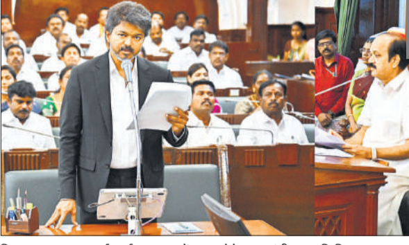
विश्वास प्रस्ताव पर हुई चर्चा का सदन में जवाब देते मुख्यमंत्री थलापति विजय।

सदन में मतों के विभाजन के दौरान मुख्यमंत्री विजय की ओर से पेश किए गए विश्वास प्रस्ताव के पक्ष में 144 मत पड़े, जबकि विरोध में 22 मत पड़े। भाजपा का एकमात्र विधायक और राजग के घटक दल पट्टाली मक्कल काची के चार विधायक मतदान के दौरान तटस्थ रहे। बहुमत की कमी के चलते सरकार को स्थिरता पर उठ रहे सवाल के बीच इस जीत ने पहली बार सत्ता में आई टीवीके सरकार को कामकाज सुचारू रूप से चलाने के लिए जरूरी मनबूती प्रदान कर दी। नियमों के मुताबिक अब अगले छह महीने तक विधानसभा में दोबारा शक्ति परीक्षण नहीं कराया जा सकेगा। विश्वास मत के बाद अब मुख्यमंत्री विजय सहित मंत्रियों को विभागों का आवंटन की