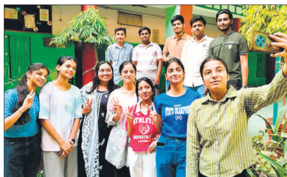
के सी एम स्कूल पर सेल्फी लेती छात्राएं।