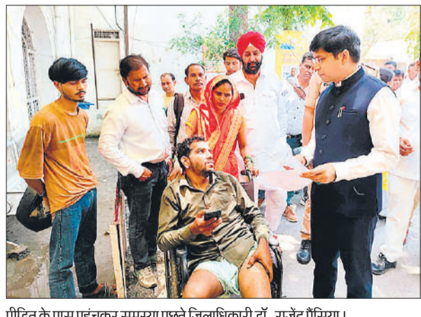
पीड़ित के पास पहुंचकर समस्या पूछते जिलाधिकारी डॉ. राजेंद्र पैंसिया।

अमृत विचार : कार्यभार संभालने के बाद से ही अपनी अलग कार्यशैली का परिचय जिलाधिकारी डॉ. राजेंद्र पैंसिया दे रहे हैं। पहले ही दिन कलक्ट्रेट स्थित उनके कक्ष के गेट पर डोर मेटल फ्रेम डिटेक्टर लगा तो इसकी चर्चा रही। फिर अगले ही दिन उन्होंने बुके की जगह एक पुष्प एक किताब से स्वागत करने की जन सामान्य से अपील कर पर्यावरण संरक्षण की पहल को आगे बढ़ाया।