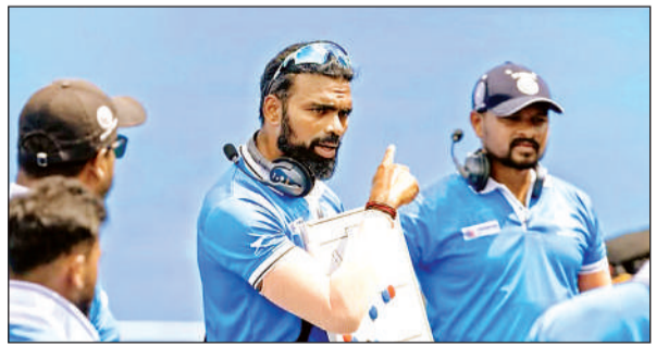
एक मैच के दौरान सलाह देते पीआर श्रीजेश।

भारत के महान गोलकीपर और जूनियर टीम के मुख्य कोच रहे पी आर श्रीजेश ने विदेशी कोचों को तरजीह देने के लिये महज 17 महीने बाद पद से हटाने को लेकर हॉकी इंडिया पर सार्वजनिक तौर पर भड़ास निकाली है। हालांकि हॉकी इंडिया ने उनके आरोप को खारिज किया। सोशल मीडिया पर मंगलवार को एक तलख पोस्ट में दो बार के ओलंपिक कांस्य पदक विजेता श्रीजेश ने लिखा कि अच्छे प्रदर्शन के बावजूद उन्हें फिर कोच नहीं बनाया गया क्योंकि हॉकी इंडिया जूनियर स्तर पर भी विदेशी कोच चाहता है। श्रीजेश ने 'एक्स' पर लिखा लगाता है कि मेरा कोचिंग कैरियर डेड साल के बाद ही खत्म हो गया है