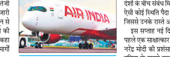
● जून से अगस्त तक होगी कटौती, पश्चिम एशिया में हवाई प्रतिबंध भी कारण

बुक करा रखे हैं उन्हें दूसरी विमानों में सीट देने में एयरलाइंस मदद करेगी। एयर इंडिया का कहना है कि वह जून से अगस्त तक हर सप्ताह उत्तर अमेरिका के लिए 33, यूरोप के लिए 47, ब्रिटेन के लिए 57, ऑस्ट्रेलिया के लिए आठ और सुदूर पूर्व, दक्षिण-पूर्व एशिया तथा साकं क्षेत्र के लिए 158 और पॉर्सिथस के लिए सात उड़ानों का परिचालन करेगी। उल्लेखनीय है कि पश्चिम एशिया संकट के कारण इस समय विमान ईंधन की कीमत रिकॉर्ड उच्चतम स्तर हैं। सरकार ने घरेलू उड़ानों के लिए विमान ईंधन की कीमतों में हर महीने के लिए 25 प्रतिशत की सीमा तय कर दी है, लेकिन अंतर्राष्ट्रीय उड़ानों के लिए यह राहत नहीं दी गई है।