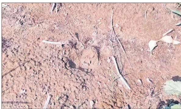
तेंदुए के पगचिन्ह।

संवादादाता हसनपुर ● वन विभाग की टीम पहुंची पगचिन्ह दिखने से पिंजरा लगाने की मांग बाद पूरे क्षेत्र में शोर मच गया। देखते ही देखते भारी संख्या में ग्रामीण लाठी-डंडे लेकर मौके पर जमा हो गए और तेंदुए को पकड़वाने के लिए खेत को चारों तरफ से घेर लिया।