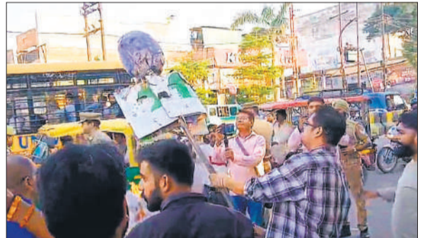
पुतला दहन के दौरान एकत्र प्रदर्शनकारी।