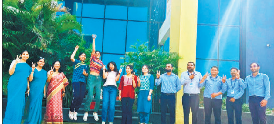
आरएएन पब्लिक स्कूल में छात्रों के साथ खुशी जताते शिक्षक।