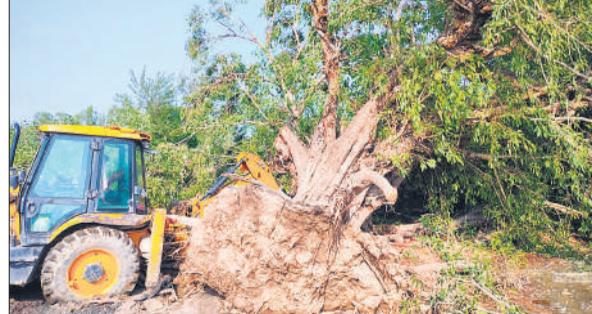
आंधी से बरेली के आंवला क्षेत्र में जड़ से उखड़ गया विशाल पेड़।