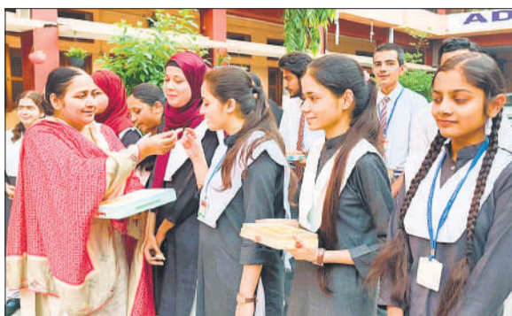
एडम एंड ईव्स कॉन्वेंट स्कूल में छात्राओं को मिठाई खिलाती शिक्षिका।

दोनों विद्यार्थियों की उपलब्धि पर स्कूल प्रबंधन और अभिभावकों ने खुशी जताई। रिजल्ट आने के बाद मेधावी विद्यार्थियों के घरों पर बधाई देने वालों का तांता लगा रहा। स्कूलों में मिठाई बांटी गई और शिक्षकों ने विद्यार्थियों की मेहनत की सराहना की। मेधावियों ने अपनी सफलता का श्रेय माता-पिता और शिक्षकों के मार्गदर्शन को दिया। उधर, रिजल्ट को लेकर सुबह से छात्रों में उत्साह बना हुआ था और रिजल्ट की घोषणा होते ही स्कूल पहुंच गए।