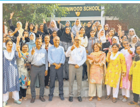
ग्रीनवुड स्कूल में परिणाम आने के बाद खुशी जताते अभ्यर्थी व शिक्षक। ● अमृत विचार