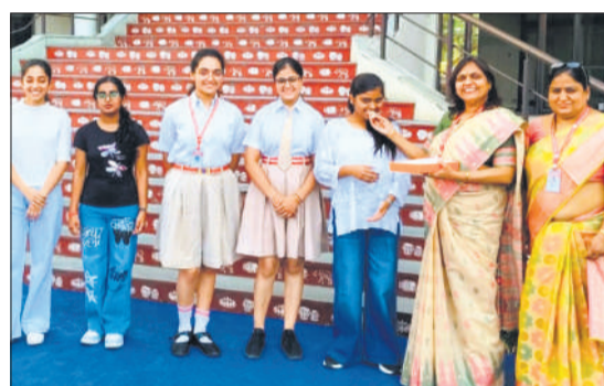
शिरडी साई पब्लिक स्कूल में समृद्धि वर्षा के मिठाई खिलाती अध्यापिका।