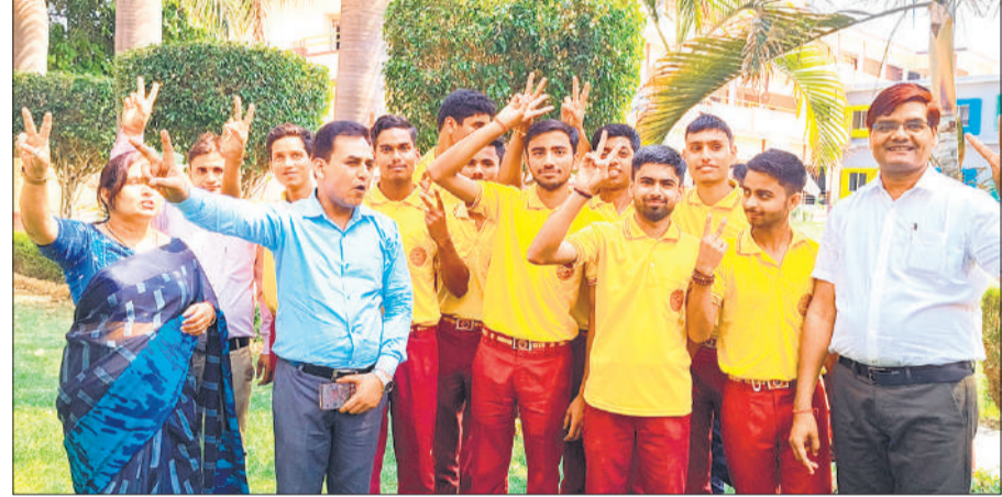
परिणाम के बाद खुशी जताते छात्र व मौजूद शिक्षक।