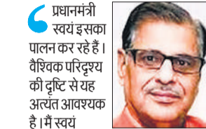
प्रधानमंत्री स्वयं इसका पालन कर रहे हैं। वैश्विक परिदृश्य की दृष्टि से यह अत्यंत आवश्यक है। मैं स्वयं सामाजिक जीवन में तामझाम व दिखावे से दूर रहता हूँ। पब्लिक ट्रांसपोर्ट के उपयोग से ईंधन खर्च कम होगा। वर्तमान परिस्थिति में सभी को प्रधानमंत्री की अपील का पालन करना चाहिए।

मुरादाबाद, अमृत विचार : प्रधानमंत्री की अपील और मुख्यमंत्री की पहल के बाद भारतीय जनता पार्टी के जन प्रतिनिधियों पर भी लोगों की नजर है। इसका किताब गंभीरता से पालन किया जाएगा या केवल रस्म अदायगी होगी, इसके पर लोगों की निगाहें हैं। हालांकि अन्य जन प्रतिनिधि भी वर्तमान वैश्विक परिस्थिति में प्रधानमंत्री की अपील को देशहित में जरूरी बता रहे हैं। स्वयं के साथ दूसरों को भी इसके प्रति प्रेरित करने की प्रतिबद्धता जता रहे हैं।