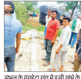
संभल के गंगहेटा गांव में इसी खम्भे के नीचे दबकर हुई महिला की मौत।